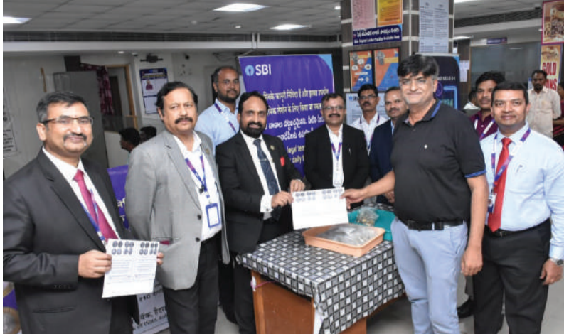
-ఎస్బీఐ జిఎం ప్రకాష్ చంద్ర భరోరు...

తరంగాలు ప్రతినిధి/వరంగల్: పది రూపాయల నాణాలు చలామణిలోనే ఉన్నాయని ఈ విషయంలో వస్తున్న దుష్ప్రచారాన్ని నమ్మరాదని భారతీయ స్టేట్ బ్యాంక్ జనరల్ మేనేజర్ (నెట్వర్కు) ప్రకాష్ చంద్ర భరోరు అన్నారు. శనివారం వరంగల్ రోడ్ లోని భారతీయ స్టేట్ బ్యాంక్ ప్రధాన శాఖలో పది రూపాయల నాణాల చలామణిపై బ్యాంక్ డీజీఎం గన్ షామ్ సోలంకి అధ్యక్షతన జరిగిన అవగాహన కార్యక్రమంలో జిఎం ప్రకాష్ చంద్ర భరోరు మాట్లాడుతూ రిజర్వ్ బ్యాంక్ తయారుచేసిన పది రూపాయల నాణాలు చలామణిలో ఉన్నప్పటికీ కొందరు ప్రజల్లో తప్పుడు ప్రచారంతో అయోమయం సృష్టిస్తున్నారని ఆందోళన వ్యక్తం చేశారు. భారతీయ