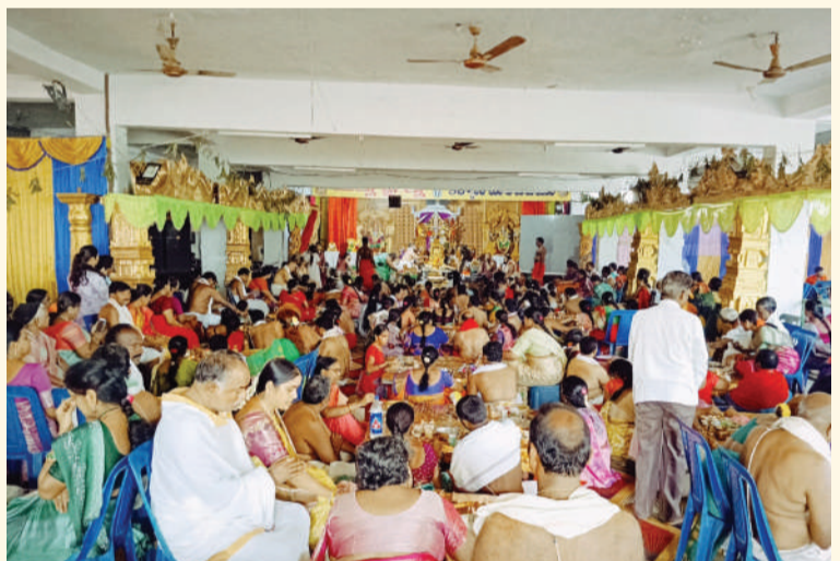
తరంగాలు /ప్రతినిధి, కేసముద్రం:

-పంచదశ వార్షిక దేవీ శరన్నవరాత్రోత్సవాలలో భాగంగా 3వ రోజు అమ్మ వారి అలంకరణ కార్యక్రమం చేపట్టింది.