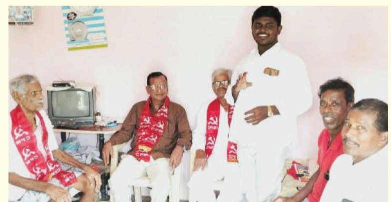
తరంగాలు ప్రతినిధి/భువనగిరి నియోజకవర్గం