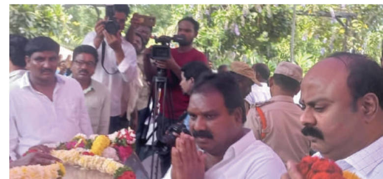
తరంగాలు ప్రతినిధి /సుహాబాబాబాద్: