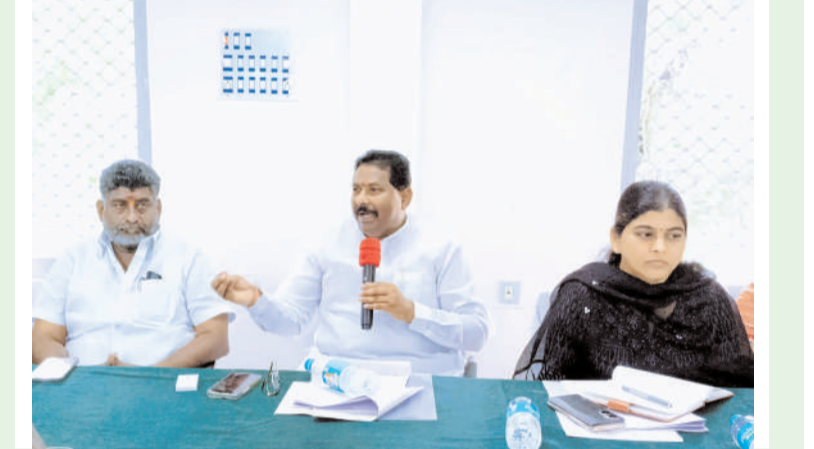
నర్సంపేట ఆర్పి, నవంబర్ 16 (తరంగాలు):

తాలు, తరుగు పేరుతో రైతులను ఇబ్బందులకు గురి చేయొద్దని అధికారులను, మిల్లర్లను నర్సంపేట ఎమ్మెల్యే దొంతి మాధవరెడ్డి ఆడిశించారు. శనివారం నర్సంపేట పట్టణంలోని మార్కెట్ కార్యాలయంలో ధాన్యం కొనుగోలు పై అధికారులు మిల్లర్లతో నర్సంపేట ఎమ్మెల్యే దొంతి మాధవరెడ్డి సమీక్ష సమావేశం నిర్వహించారు. ఈ సందర్భంగా ఎమ్మెల్యే మాట్లాడుతూ పంట పూర్తిగా పండిన తర్వాతనే పరికోతలు చేయాలని రైతులకు సూచించారు. కొనుగోలు కేంద్రాలను అధికారులు ఎప్పటికప్పుడు పరిశీలించాలన్నారు. రైతులు, మిల్లర్ల సమస్యలను అడిగి తెలుసుకున్నారు. రైతుల నుండి ధాన్యం కొనుగోలు చేసే సమయంలో అధికారులు పర్యవేక్షణ చేసి రైతులకు ఎలాంటి ఇబ్బందులు కలగకుండా సహకరించాలని మిల్లర్లు, ఐకెపి సెంటర్లు రైతులకు కావాల్సిన సౌకర్యాలు కల్పించాలని సూచించారు. ధాన్యం కొనుగోలు సందర్భంలో మిల్లర్లకు పూర్తి సహకారం ఉంటుందని అన్నారు.