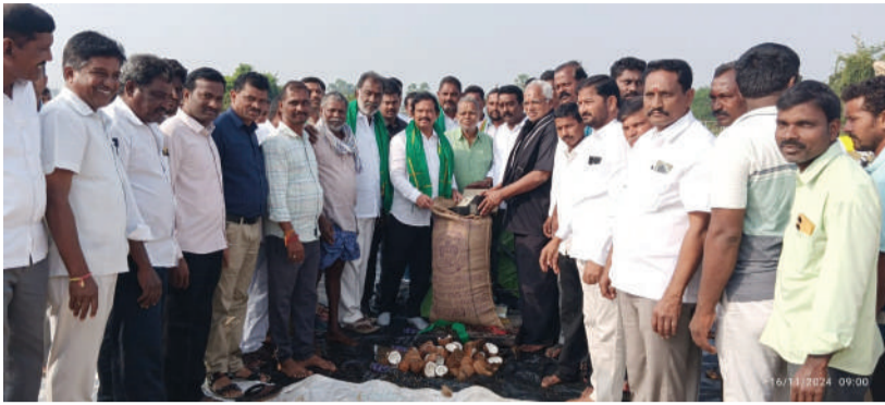
-బోనస్ పల్ల రైతుకు ఒక ఎకరాకు దాదాపు పదివేల రూపాయల లబ్ధి -రైతులు దళారులను నమ్మపడ్డ -మహబూబాబాద్ ఎమ్మెల్యే డాక్టర్ మురళి నాయక్