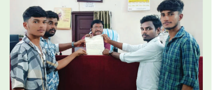
పర్వతగిరి, నవంబర్ 16(తరంగాలు):