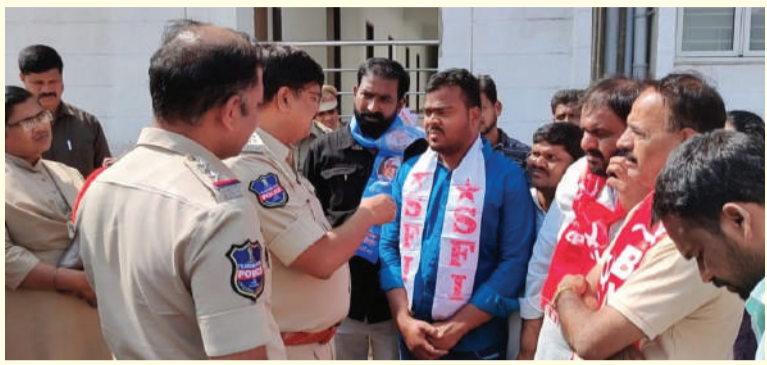
సంగారెడ్డి, నవంబర్ 16 (తరంగాలు):