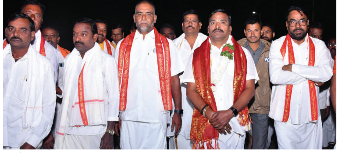
కమిటీ చైర్మన్, యాదగిరిగుట్ట మున్సిపల్ చైర్మన్ నియోజకవర్గం నుండి భక్తులు పెద్ద సంఖ్యలో కాన్సిలర్లు, తెలంగాణ రాష్ట్రం నుండి ఆలేరు పాల్గొన్నారు.