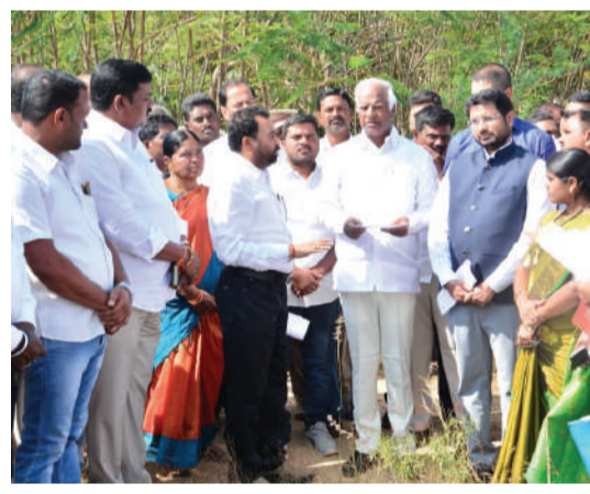
వారంలోగా టెండర్ ప్రక్రియ పూర్తి చేయాలని అధికారులను ఆదేశించారు. నియోజకవర్గ కేంద్రంలో ప్రభుత్వ డిగ్రీ కళాశాల మంజూరు అయిందని, వచ్చే విద్యా సంవత్సరం నుండి ప్రారంభించాలని తెలిపారు. డిగ్రీ కళాశాల నిర్మాణానికి స్థలాన్ని గుర్తించాలని, అలాగే కళాశాల ఏర్పాటుకు తాత్కాలిక భవనాన్ని సైతం గుర్తించాలని అన్నారు. షేక్ షాద్ కుడి వక్కన ఉన్న స్థలంలో ఇంటిగ్రేటెడ్ వెజ్ అండ్ నాన్ వెజ్ మార్కెట్ నిర్మాణానికి, ఎడమ వక్కన వెటర్నరీ అస్పత్రి నిర్మాణానికి సాధ్యమైన స్థలాలను పరిశీలించాలని సంబంధిత అధికారులను ఆదేశించారు. 132/33 KV సబ్ స్టేషన్ లో విద్యుత్ శాఖ డీఈ ఆఫీస్ నిర్మాణం తో పాటు 3నబ్ స్టేషన్ నిర్మాణానికి సంబంధించి టెండర్ ప్రక్రియ పూర్తి చేయాలని అన్నారు. విటన్సింటిని డిసెంబర్ చివరి వారం లేదా జనవరి మొదటి వారంలో ముఖ్యమంత్రి రేవంత్ రెడ్డి శంకుస్థాపన చేయనున్నట్లు వెల్లడించారు. కావున ఆలోపే డిజైన్, ఎస్పీఎంసీ, టెండర్ల పూర్తి కావాలని సుప్రం చేశారు. స్టేషన్ ఘనపూర్ రిజర్వాయర్ నుండి

జుఫర్ డ్ నవంబర్ 29(తరంగాలు): మండలంలోని కొనాయిచలంలో నిర్మించనున్న యంగ్ ఇండియా ఇంటిగ్రేటెడ్ రెసిడెన్షియల్ స్కూల్ కాంప్లెక్స్, స్టేషన్ ఘనపూర్ మండల కేంద్రంలో నిర్మించనున్న ఇంటిగ్రేటెడ్ డివిజనల్ ఆఫీస్ కాంప్లెక్స్, ఇంటిగ్రేటెడ్ వెజ్, నాన్ వెజ్ మార్కెట్ నిర్మాణ స్థలాలను జనగామ జిల్లా కలెక్టర్ లిజ్యాన్ బాషా షేక్ కలిసి ఎమ్మెల్యే కడియం శ్రీహరి క్షేత్ర స్థాయిలో పరిశీలించారు. అంతర్లం ఎంపీడివో కార్యాలయంలో అధికారులతో సమీక్షా సమావేశం నిర్వహించారు. ఈ సందర్భంగా ఎమ్మెల్యే మాట్లాడుతూ యంగ్ ఇండియా ఇంటిగ్రేటెడ్ రెసిడెన్షియల్ స్కూల్ కాంప్లెక్స్ జుఫర్ గడ్డ మండలం కొనాయిచలం గ్రామ రెవెన్యూ పరిధిలోని 21 ఎకరాల స్థలంలో రాష్ట్ర ప్రభుత్వం ప్రతిష్ఠాత్మకంగా చేపట్టిన యంగ్ ఇండియా ఇంటిగ్రేటెడ్ రెసిడెన్షియల్ స్కూల్ కాంప్లెక్స్ ను నిర్మించనున్నట్లు తెలిపారు. అత్యాధునిక వసతులతో, కార్పొరేట్ స్థాయి హంగులతో ఏర్పాటు కాబోతుందని అన్నారు. 200కోట్ల రూపాయలతో ఈ ఇంటిగ్రేటెడ్ రెసిడెన్షియల్ స్కూల్ కాంప్లెక్స్ నిర్మించనున్నట్లు వివరించారు. స్థలానికి సంబంధించి ఎలాంటి ఇబ్బందులు లేకుండా చూసుకోవాలని, డిజైన్, ల్యాండ్ లేవలింగ్ వంటి అంశాలను దృష్టిలో పెట్టుకొని వీలైనంత తొందరలో టెండర్ ప్రక్రియ పూర్తి చేయాలని సంబంధిత అధికారులకు సూచించారు. ఇంటిగ్రేటెడ్ డివిజనల్ ఆఫీస్ నిర్మాణానికి 26కోట్ల రూపాయలతో పరిపాలన అనుమతులు వచ్చాయని అన్నారు. పాత భవనాల కూల్చివేత, ల్యాండ్ లేవల్, అంతర్గత సిని రోడ్డు, డ్రైనేజీ వంటి వాటిని కలుపుకొని ఎస్పీఎంసీ చేయాలని అన్నారు. డిసెంబర్ మొదటి