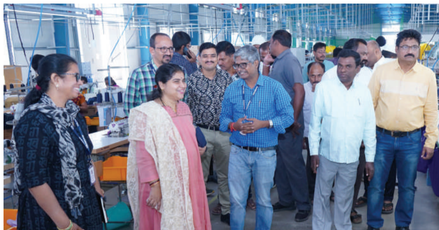
-వరంగల్ జిల్లా కలెక్టర్ డా.సత్య శారద -టెక్స్ టైల్ పార్కు లో నాలా పనుల బలోపేతం పై ప్రత్యేక దృష్టి సారించాలని ఆదేశం.... -యంగ్ వన్ ప్రతినిధులతో సమావేశం....