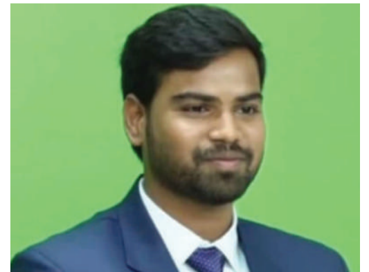
రఘునాథపల్లి,నవంబర్,29(తరంగాలు) నిరుపేద తల్లిదండ్రులు ఆశయాలు నెరవేర్చుడమే