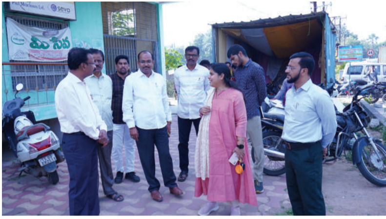
జిల్లా కలెక్టర్ డాక్టర్ సత్య శారద