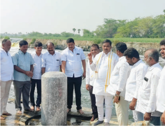
-ప్రభుత్వ విప్ ఎమ్మెల్యే బీర్ల ఐలయ్య -మూసి పునర్జీవయాత్ర ఏర్పాట్లను పరిశీలించిన ప్రభుత్వ విప్ ఆలేరు ఎమ్మెల్యే బీర్ల ఐలయ్య -మూసి ప్రక్షాళనలో మొదటి అడుగు