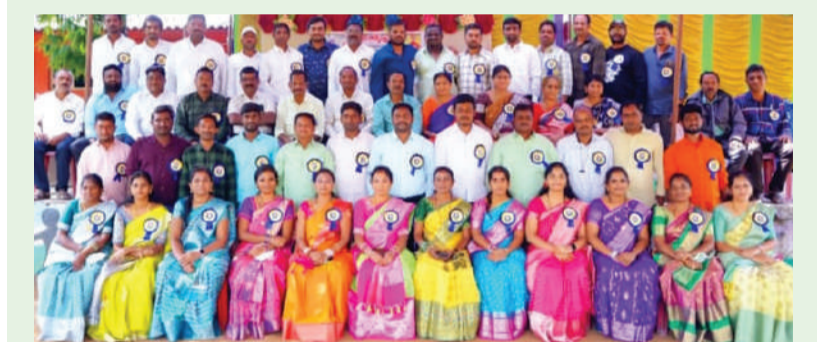
చెన్నారావుపేట, నవంబర్ 10, (తరంగాలు):