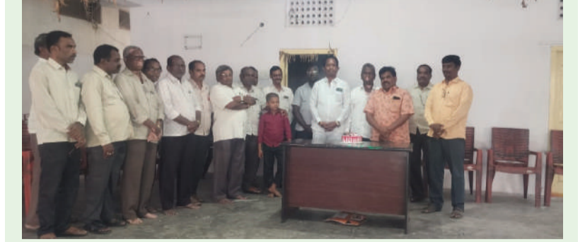
రఘునాథపల్లి, నవంబర్, 10 (తరంగాలు)