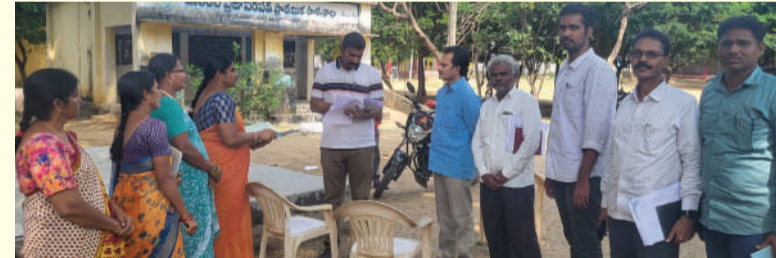
నర్సింహాలపేట, నవంబర్ 10 (తరంగాలు):