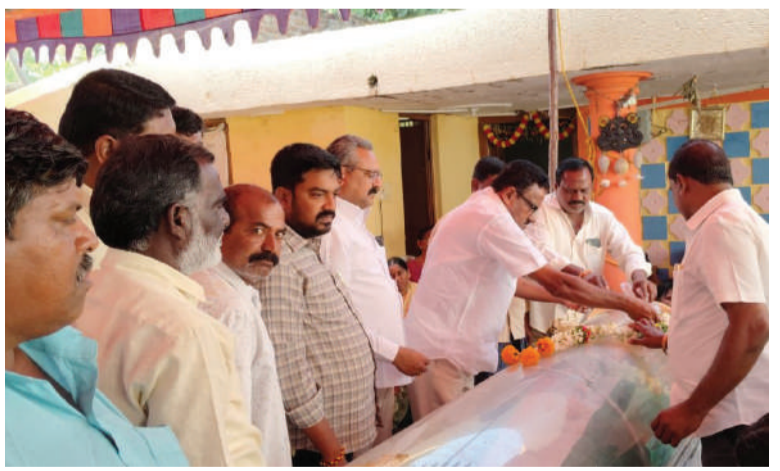
రఘునాథపల్లి, నవంబర్, 10 (తరంగాలు)