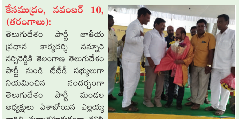
కేసముద్రం, నవంబర్ 10, (తరంగాలు):