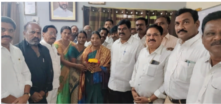
తరంగాలు/ఖమ్మం జిల్లా బ్యూరో ఉమ్మడి ఖమ్మం జిల్లా :

-కమిషనర్ను కలిసిన రాష్ట్ర మార్కెట్ ఫెడ్ డైరెక్టర్ కొత్వాలు, కాంగ్రెస్ నాయకులు