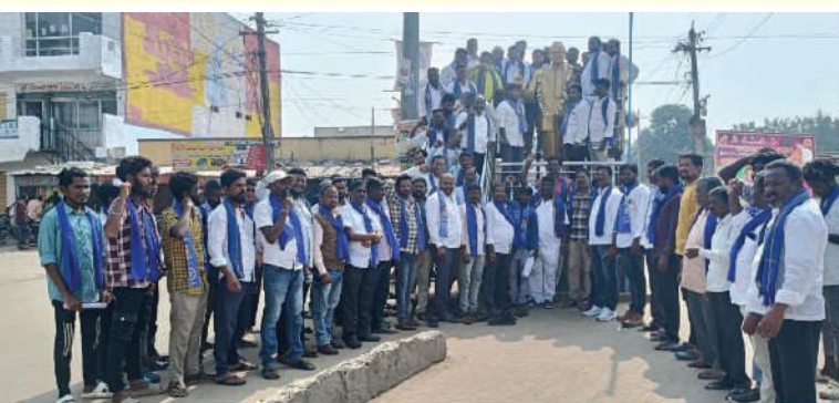
చెన్నూర్, నవంబర్ 24. (తరంగాలు):

-మాలల సింహ ఘర్షణ సభను విజయవంతం చేయాలని నాయకుల పిలుపు