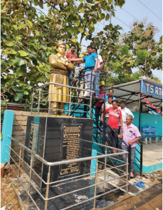
ఓ-పూలమాల వేసి నివాళులర్పించిన వీ హెచ్ పీ నేతలు -విగ్రహానికి ఎలాంటి అటంకాలు కలిగించొద్దని డిమాండ్