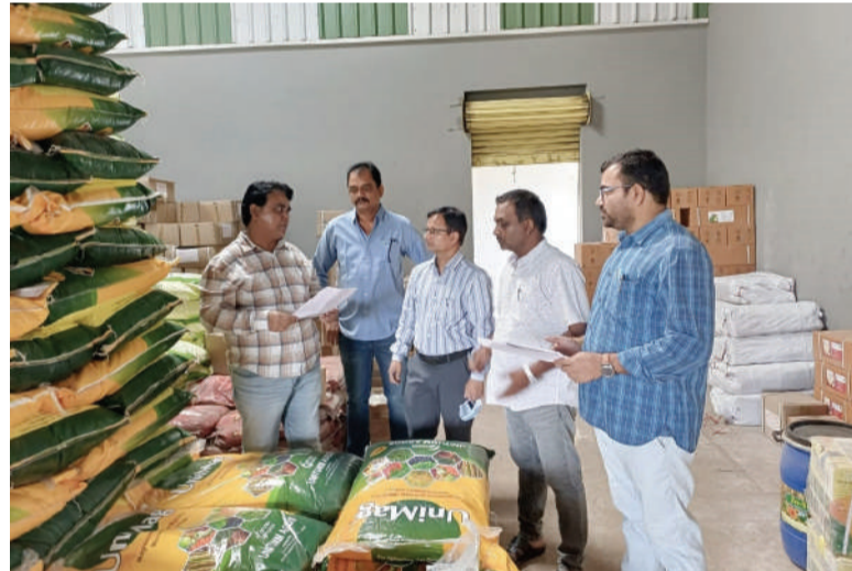
మిర్యాలగూడ ఆర్టీ, డిసెంబర్ 14 (తరంగాలు):