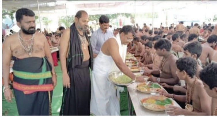
విద్యాలగూడ ఆర్సీ, డిసెంబర్ 14(తరంగాలు):

బి ఎల్ ఆర్ బ్రదర్స్ సంస్థ ఆధ్వర్యంలో స్థానిక అయ్యప్ప స్వామి దేవాలయంలో నిర్వహిస్తున్న మహా అన్నప్రసాద వితరణ కార్యక్రమం శనివారం 25వ రోజుకు చేరింది. ఈ సందర్భంగా, విరాళదాతలు, సంఘ సభ్యులు, మరియు విశ్వసనీయుల నుంచి అన్నదానం అందజేసి కార్యక్రమంలో విశేషమైన స్పందన వచ్చింది. అన్నదాన కార్యక్రమానికి ప్రత్యేక ఆహ్వానం అందించి, ఓం శ్రీ స్వామియే శరణమయ్యం అన్నదాన ప్రభువే శరణమయ్యం అంటూ వారు ఆశీర్వాదించారు. ఈ కార్యక్రమంలో పెద్ద సంఖ్యలో స్థానికులు పాల్గొని అన్నప్రసాద వితరణలో భాగస్వాములయ్యారు. 25 రోజులుగా జరుగుతున్న ఈ కార్యక్రమం, సమాజానికి పెద్ద సాయంగా నిలుస్తుంది.