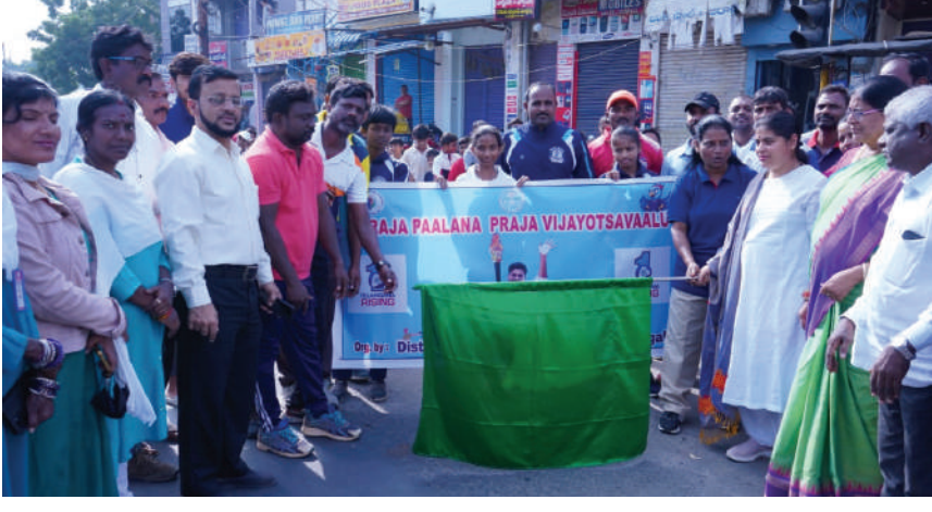
-జిల్లా కలెక్టర్ డాక్టర్ సత్య శారద -ప్రజా పాలన ఉత్సవాల్లో భాగంగా అదనపు కలెక్టర్ -సంధ్యారాణి తో కలిసి 23 రన్ ర్యాలీని ప్రారంభించిన కలెక్టర్