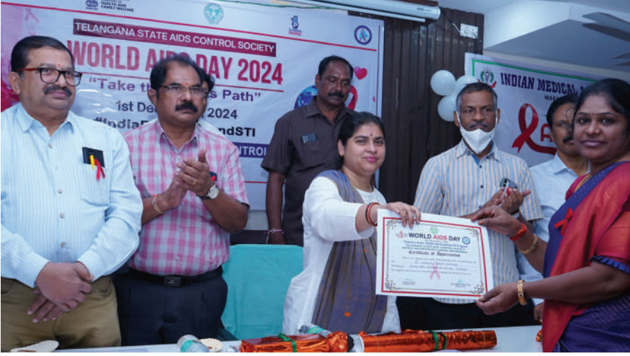
-జిల్లా కలెక్టర్ డాక్టర్ సత్య శారదా