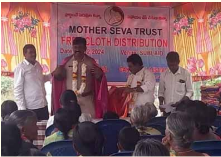
పాలేరు ఆర్పీ 24డిసెంబర్(తరంగాలు)