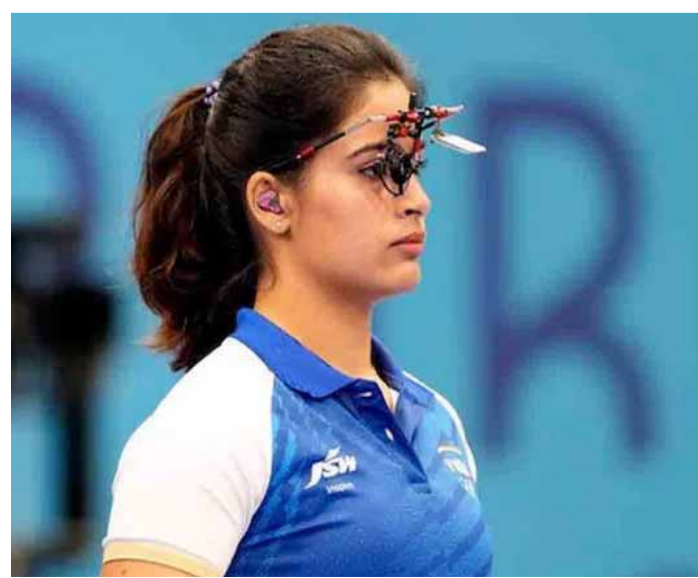
పేరు ఉండే అవకాశాలు ఎక్కువగా ఉన్నాయని కేంద్ర

దేశ క్రీడా రంగ ప్రతిష్టాత్మక అవార్డు ధ్యాన్చంద్ ఫేల్తర్ తప్ప విజేతలను కేంద్రం త్వరలో ప్రకటించనుంది. అయితే, ఈ పురస్కారానికి సిఫారసు చేసిన జాబితా నన్ను బయటకు వచ్చిన విషయం తెలిసింది. ఈ జాబితాలో ఈ ఏడాది పారినలో జరిగిన ఒలింపిక్స్లో రెండు పతకాలు సాధించి చరిత్ర సృష్టించిన స్టార్ ఘాటర్ మనూ భాకర్ (%మీఐబి డిప్లూనివతీ%) పేరు లేకపోవడం సంచలనం రేపుతోంది. ఈ అంశంలో కేంద్రంపై ప్రతిపక్షాలు తీవ్ర విమర్శలు చేస్తున్నాయి. అయితే, పురస్కారానికి ఇంకా తుది ప్రతిపాదనల జాబితా సిద్ధం కాలేదని, అందులో మను