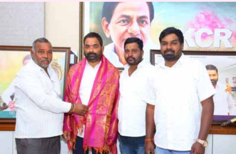
కుత్తుల్పూర్ డిసెంబర్ 26 (తరంగాలు)