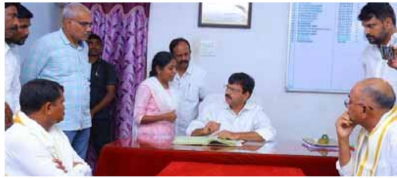
దమ్మపేట,డిసెంబర్ 26 (తరంగాలు)