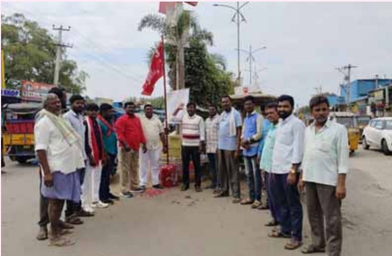
నారాయణఖేడ్,డిసెంబర్ 26 (తరంగాలు)