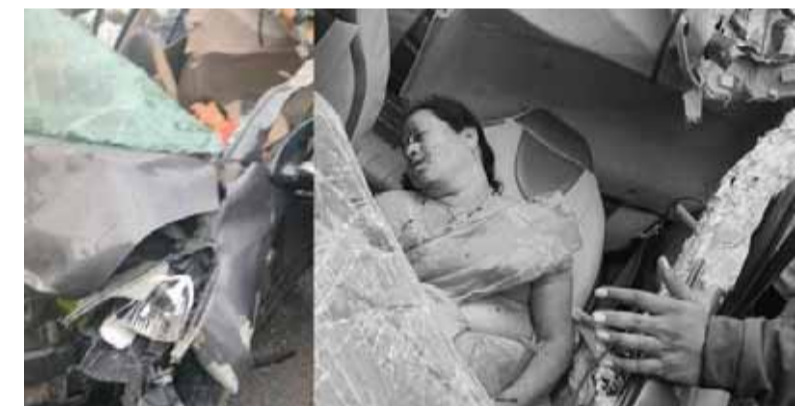
వేములవాడ డిసెంబర్ 26 (తరంగాలు)

వేములవాడ - కరీంనగర్ ప్రధాన రహదారిలోని బోయినపల్లి మండలం వెంకట్రావు పేట వద్ద గురువారం ఉదయం ఘోర రోడ్డు ప్రమాదం చోటుచేసుకుంది. ఆగి ఉన్న లారీని వెనక నుండి కారు అతివేగంగా వెళ్లి ఢీ కొనడంతో కారులోని ఒకరు అక్కడికక్కడే మృతి చెందగా మరో ముగ్గురి పరిస్థితి విషమంగా ఉంది. ప్రమాదానికి గురైన వారు కరీంనగర్ సమీపంలోని తిమ్మాపూర్ కు చెందిన వారిగా గుర్తించారు. తిమ్మాపూర్ కు చెందిన అయ్యప్ప స్వాములు కుటుంబ సభ్యులతో కలిసి వేములవాడ రాజన్నను దర్శించుకుని తిరిగి వెళుతున్న సమయంలో ఈ ప్రమాదం జరిగినట్లు తెలుస్తోంది. పూర్తి వివరాలు తెలియాలి ఉంది.