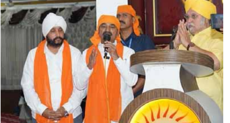
మేడ్చల్,డిసెంబర్ 26 (తరంగాలు)

దేశ రక్షణ కోసం, ధర్మ రక్షణ కోసం, మన స్వేచ్ఛ కోసం వందల సంవత్సరాల క్రితం అనేక మంది ప్రాణాలు అర్పించారని మల్లాజిగిరి ఎంపీ ఈటల రాజేందర్ కీలక వ్యాఖ్యలు చేశారు వారిని స్మరించుకోవడం మన కర్తవ్యమన్నారు. ఈ మేరకు ఇవాళ సికింద్రాబాద్ గురుద్వారాలో వీర్ బాల్ దివస్ కార్యక్రమంలో ప్రసంగించారు. గురు గోవింద్ సింగ్ ఆయన నలుగురు పిల్లలు యుద్ధంలో మరణించారని తెలిపారు. వారి బలిదానాల నుంచి మనకు ఈ స్వేచ్ఛ స్వతంత్రతలు వచ్చాయన్నారు. సిక్కు గురుదేవుల, వారి పిల్లల త్యాగాలను భవిష్యత్తు తరాలు గుర్తు చేసుకునే విధంగా ఉండాలని, స్ఫూర్తి పొందాలని భారత ప్రధాని మోడీ దేశవ్యాప్తంగా ఈ కార్యక్రమాన్ని నిర్వహిస్తున్నారని వెల్లడించారు.బిర్సా ముండాతో పాటు అనేక మంది రియల్ హీరోస్ ఆఫ్ ఇండియాను గుర్తించి వారి జయంతలు, వర్ణంతులు నిర్వహిస్తున్నారని అన్నారు. ఈ అమరుల త్యాగాలు వృధా కావని చెప్పారు. వందల ఏళ్ల పాటు భరత జాతి ఏకోన్మఖమై స్వాతంత్రం కోసం పోరాడారని, లక్షలాది మంది జైలు పాలయ్యారని గుర్తుకు చేశారు. వేలాదిమంది ప్రాణత్యాగాలు చేశారని, ఆ త్యాగాల ఫలితమే మన స్వాతంత్రమని వివరించారు. వీర్ బాల్ దివస్ పేరుతో ప్రధానమంత్రి నిర్వహిస్తున్న ఈ కార్యక్రమం ద్వారా జాతి స్ఫూర్తి పొందాలని ఈటల రాజేందర్ అన్నారు.