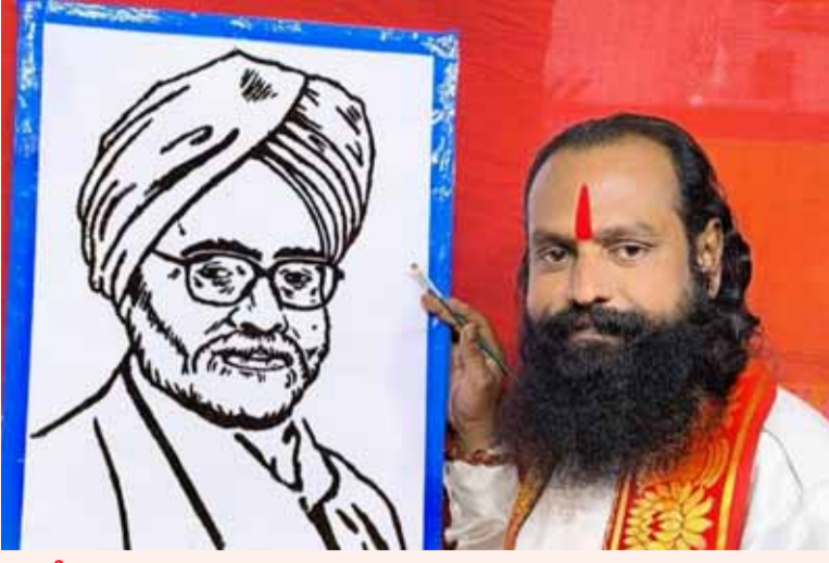
సిద్దిపేట జిల్లా (తరంగాలు)