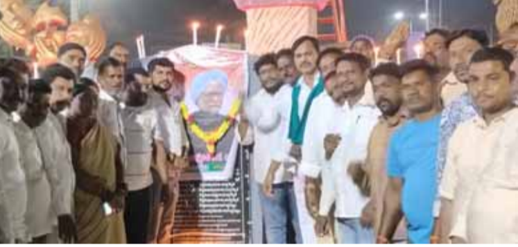
-యువజన కాంగ్రెస్ ఆధ్వర్యంలో వర్తన్పేటలో క్రావ్సత్తుల ర్యాలీ