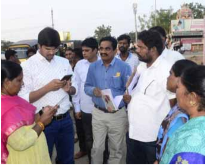
ఎన్యూమరేటర్ లతో సహకరించాలని తెలిపారు. ప్రతి రోజు నిర్దేశించుకున్న లక్ష్యం మేరకు ఎన్యూమరేటర్ లు ఇందిరమ్మ ఇండ్ల దరఖాస్తు సర్వే పూర్తి