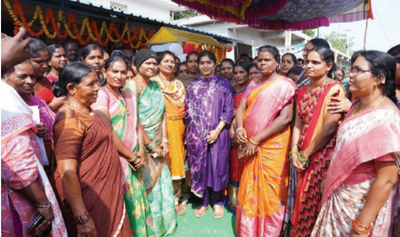
-మహిళా సాధికతకు ప్రభుత్వం కట్టుబడి ఉంది -ఎమ్మెల్యే యశస్విని రూస్సీ రెడ్డి...

తొర్రుర్, 06డిసెంబర్ (తరంగాలు): అమ్మ చేతి వంట నాణ్యతను అందించాలని పాలకుర్తి ఎమ్మెల్యే యశస్విని రూస్సీ రెడ్డి ఇందిరా మహిళా శక్తి క్యాంప్ వినయపూర్వకంగా ప్రాతిపదికన శుక్రవారం తొర్రుర్ పట్టణంలో రాష్ట్ర ప్రభుత్వం మహిళా అభ్యున్నతికి చేయూతనిస్తూ.. మహిళా సంఘాల ఆధ్వర్యంలో ఏర్పాటు చేసిన ఇందిరా మహిళా శక్తి