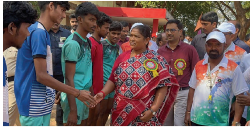
-క్రీడల్లో గెలుపోటములు సహజం -మంత్రి దనసరి అనసూయ సీతక్క

ములుగు ప్రతినిధి, 11డిసెంబర్ (తరంగాలు): క్రీడల్లో గెలుపు ఓటమి సహజమని, గెలుపొందిన క్రీడాకారులు ఉప్పొంగిపోకుండా క్రీడ వైపుణ్యాన్ని పెంపొందించుకోవాలని, ఓటమి చెందిన క్రీడాకారులు కృంగిపోకుండా గెలుపు కోసం ప్రయత్నించాలని రాష్ట్ర పంచాయితీ రాజ్, గ్రామీణ అభివృద్ధి, గ్రామీణ నీటి సరఫరా మహిళా శిశు సంక్షేమ శాఖ మంత్రి దనసరి అనసూయ సీతక్క అన్నారు. బుధవారం ములుగు మండలంలోని జాకారం గ్రామంలో గల సాంఘిక సంక్షేమ గురుకుల పాఠశాలలో నిర్వహించిన సీఎం కెవ్ క్రీడా పోటీలలో రాష్ట్ర పంచాయితీ రాజ్, గ్రామీణ అభివృద్ధి, గ్రామీణ నీటి సరఫరా మహిళా శిశు సంక్షేమ శాఖ మంత్రి దనసరి అనసూయ సీతక్క, జిల్లా