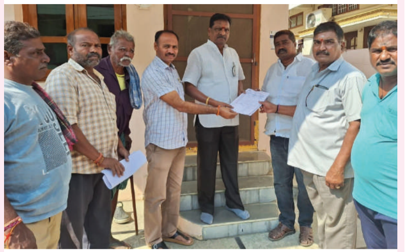
నర్సంపేట డిసెంబర్ 18 తరంగాలు:

బి ఆర్ టి యు జిల్లా అధ్యక్షుడు గోనే యువరాజు