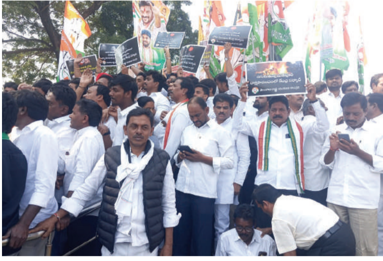
హైదరాబాద్, 18డిసెంబర్, తరంగాలు:

దేశ ప్రధాని నరేంద్ర మోడీ అండదండలతో అదానీ దేశంలోని వ్యవస్థలను, బ్యాంకులను మళ్ళిపెడుతున్నారని, అదానీ స్కాంలతో దేశ ప్రతిష్ఠ దిగజారిపోతుందని కాంగ్రెస్ పార్టీ