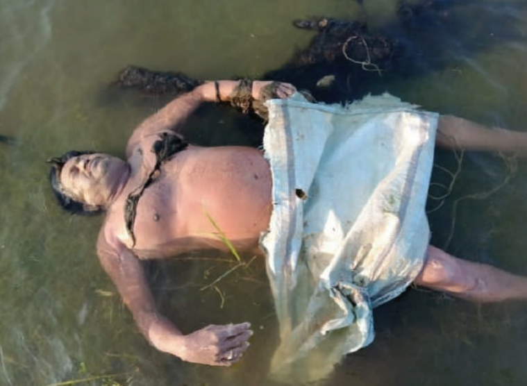
పాలేరు ఆర్పీ 18డిసెంబర్ (తరంగాలు)