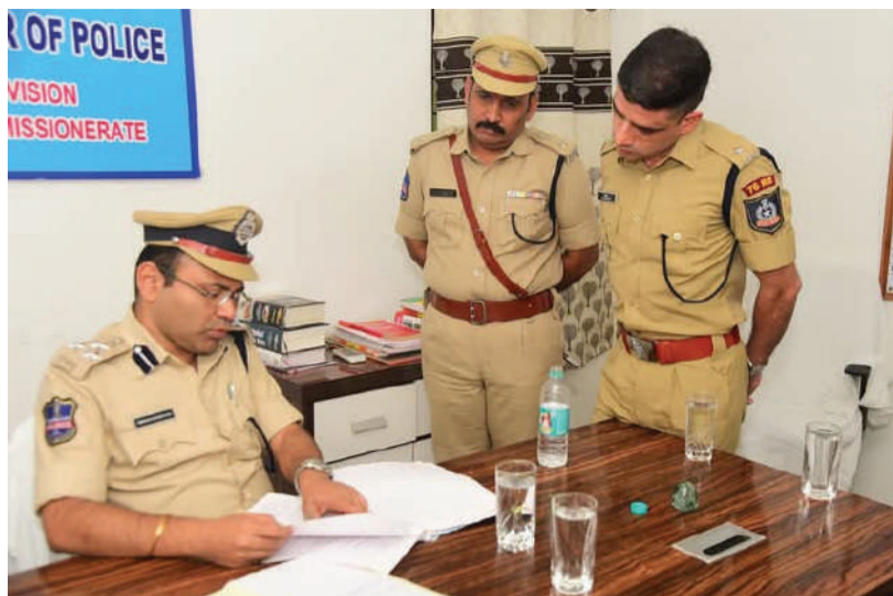
-వరంగల్ పోలీస్ కమిషనర్ అంబర్ కిషోర్ రూ