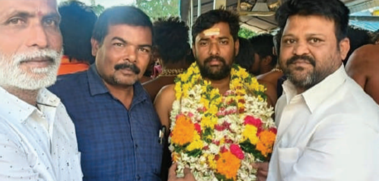
పాలేరు ఆర్పీ.18డిసెంబర్ (తరంగాలు).