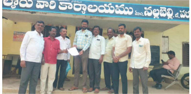
నల్లబెల్లి, 18డిసెంబర్, తరంగాలు:

-తహసీల్దార్ కు వినతిపత్రం అందజేసిన ఉద్యమకారుల ఫోరం నేతలు