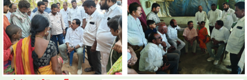
రాయపర్తి, 18డిసెంబర్, తరంగాలు :

పలు మృతుల కుటుంబాలకు మాజీ మంత్రి ఎర్రబెల్లి పరామర్శ