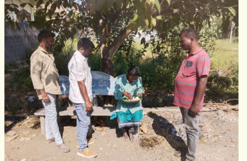
కొత్తపేట, 18డిసెంబర్, తరంగాలు: