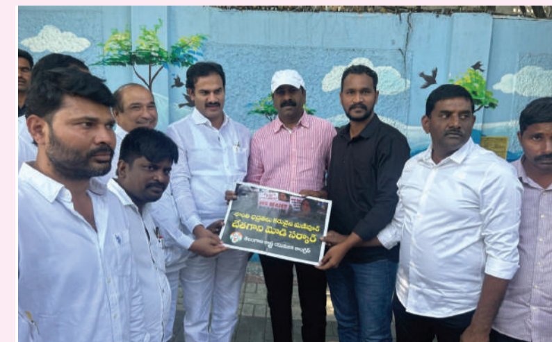
హైదరాబాద్, 18డిసెంబర్, తరంగాలు: