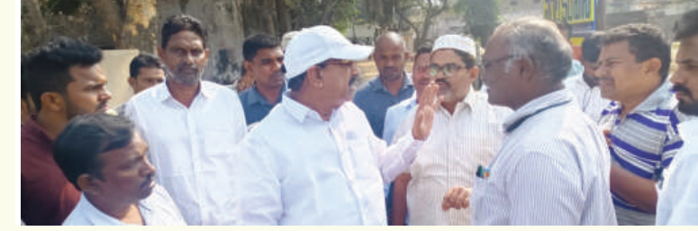
అశ్వారావుపేట డిసెంబర్ 13 (తరంగాలు)

జాతీయ రహదారి నిబంధనలకు అనుగుణంగా అశ్వారావుపేట సెంట్రల్ లైటింగ్, డ్రైనేజీ నిర్మాణాలను చేపట్టాలని వ్యవసాయ శాఖ మంత్రి తుమ్మల నాగేశ్వరరావు ఆర్ అండ్ బీ శాఖ అధికారులకు సూచించారు. అశ్వారావుపేటలో చేపట్టిన డ్రైనేజీ నిర్మాణ పనులను శుక్రవారం ఆయన పరిశీలించారు. ఈ సైట్ డ్రైనేజీ పనులను ఒక చోట ఎక్కువ మరొకచోట తక్కువ తీస్తున్నారని పిర్యాదులు వస్తున్నాయని అలా కాకుండా జాతీయ రహదారికి నిర్దేశించిన కొలతలు ప్రకారం డ్రైనేజీలు, విస్తరణ చేపట్టాలని అన్నారు. ఏ ప్రాంతంలో ఎంత పోయినా కూడా రహదారి నిబంధనలు ప్రకారం సర్వే చేసి అడ్డం వచ్చిన వాటిని తొలగించాలని, మూడు రోడ్ల కూడలి లో నుంచొని చూస్తే డ్రైనేజీలు నేరు గా కనపడాలి, వంకర, టింకర చేయకుండా చూడండి. అదేవిధంగా నాణ్యత లోనూ రాజీ పడవద్దని డి.ఈ.ఈ శ్రీనివాసరావు కు ఆదేశించారు. ఈ కార్యక్రమంలో ఏ.ఈ.ఈ శ్రీనివాస్, రాకేష్ లు ఉన్నారు.