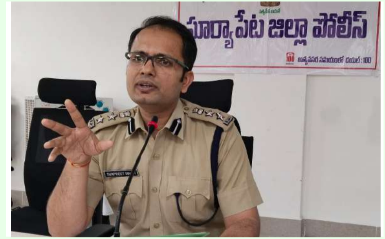
సూర్యాపేట జిల్లా బ్యూరో, జనవరి 7, తరంగాలు