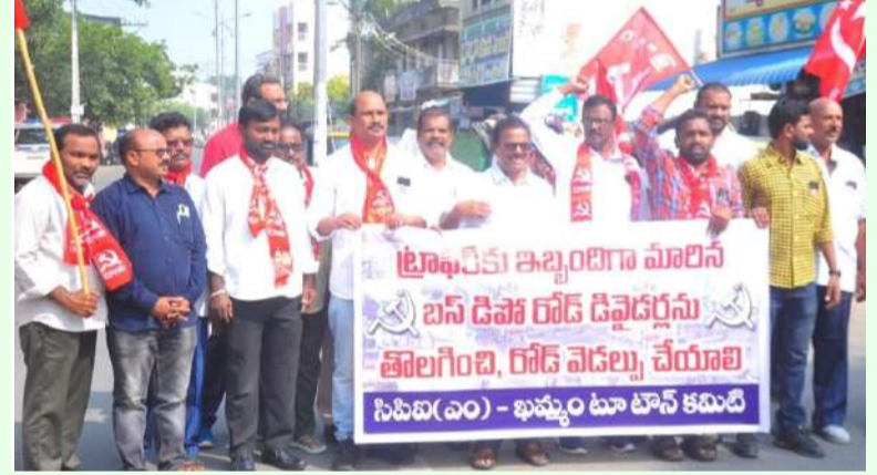
తరంగాలు/ఖమ్మం జిల్లా బ్యూరో ఖమ్మం :