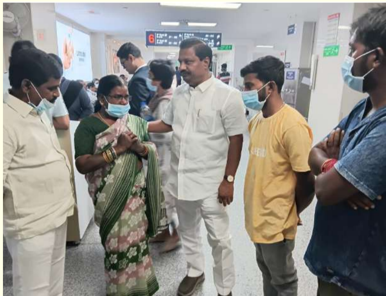
ఆలేరు ఆర్సీ, జనవరి 07(తరంగాలు)