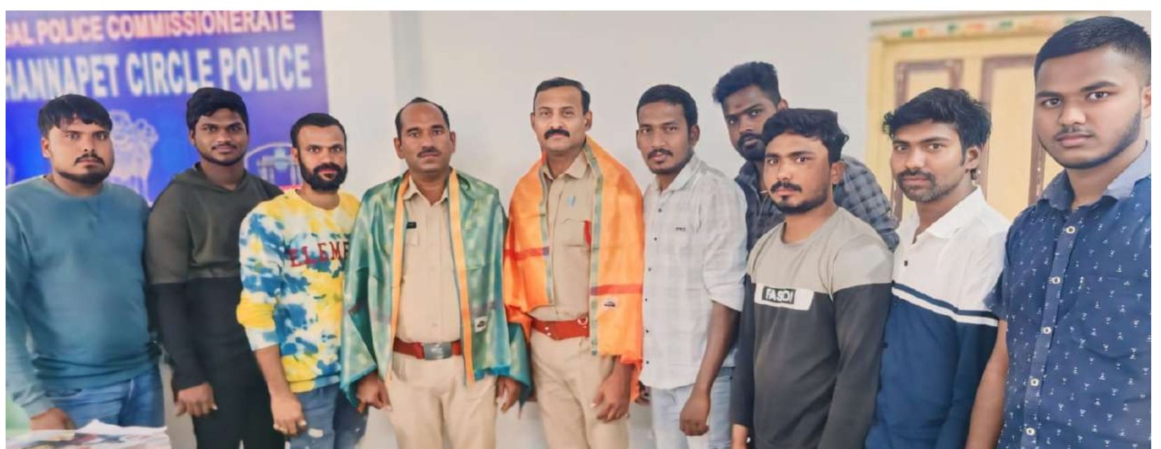
పవన్ కళ్యాణ్ అభిమాన సంఘం అధ్యక్షులలో నూతన సంవత్సర క్యాలెండర్