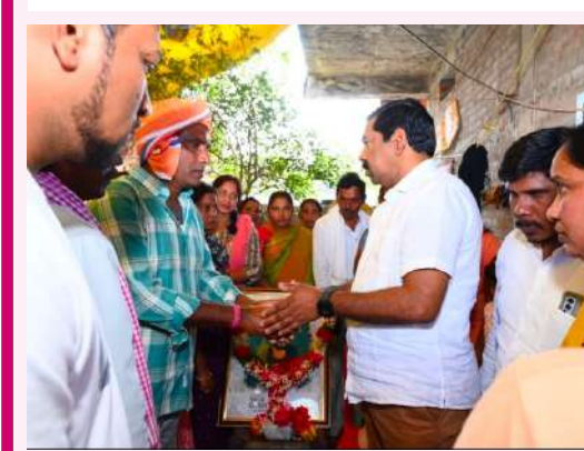
ఐనవోలు, 02జనవరి, తరంగాలు: