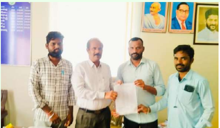
చెన్నూర్, జనవరి 02. (తరంగాలు)