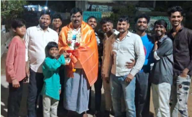
తరంగాలు/భువనగిరి జిల్లా బ్యూరో

-రాష్ట్ర మార్కెట్ డైరెక్టర్, డి సి ఎం ఎస్ చైర్మన్ కొత్తూరి బుధవారం రాత్రి కొత్తూరి ఇంటి వద్ద సంక్రాంతి వేడుకలు