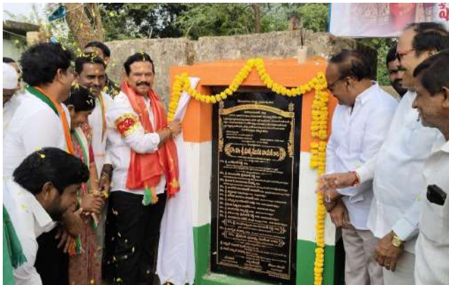
పూజ చేశారు పార్టీలకు అతీతంగా గ్రామ గ్రామ అభివృద్ధి లక్ష్యంగా ప్రతి ఒక్కరూ అభివృద్ధిలో

మున్సిపల్ పరిధిలోని 30వ వార్డ్ లో సీడిఎఫ్ నిధులతో మంజూరైన సుమారు 5 లక్షల రూపాయల వ్యయంతో నూతన సీసీ రోడ్ల నిర్మాణ పనుల్లో ముఖ్య అతిథిగా హాజరై భూమి పూజ చేశారు 24వ వార్డ్ లో సీడిఎఫ్ నిధులతో మంజూరైన సుమారు 5 లక్షల రూపాయల వ్యయంతో నూతన సీసీ రోడ్ల నిర్మాణ పనుల్లో ముఖ్య అతిథిగా హాజరై భూమి పూజ చేశారు 6వ వార్డ్ జేతోల్ లో సీడిఎఫ్ నిధులతో మంజూరైన సుమారు 5 లక్షల రూపాయల వ్యయంతో నూతన సీసీ రోడ్ల నిర్మాణ పనుల్లో ముఖ్య అతిథిగా హాజరై భూమి