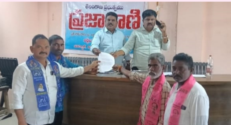
పాలేరు ఆర్డీ .20జనవరి(తరంగాలు)

-ప్రజావాణిలో వినతి పత్రాన్ని అందజేసిన బీఎస్పీ, బీఆర్ఎస్, నాయకులు.