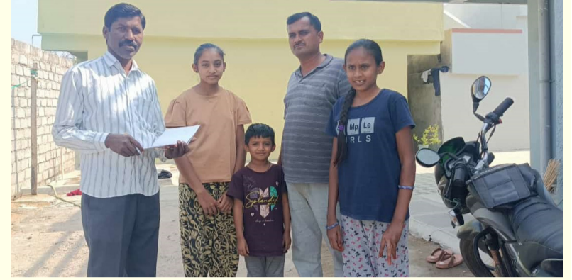
జఫర్గడ్ ప్రతినిధి, జనవరి 20, (తరంగాలు):