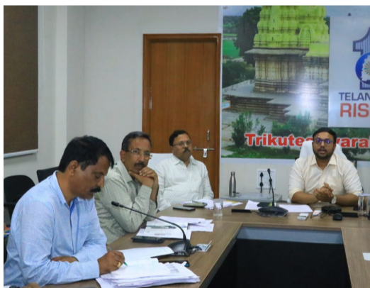
రైతు భరోసా ఇందిరమ్మ ఆత్మీయ భరోసా కొత్త రేషన్ కార్డులు ఇందిరమ్మ ఇల్లు వంటి కీలకమైన నాలుగు సంక్షేమ పథకాలు అమలకు జనవరి 26న ప్రారంభించిన నేపథ్యంలో ఈ నెల 21 నుండి 24 వరకు నిర్వహించే గ్రామ సభలను షెడ్యూల్ ప్రకారం కచ్చితంగా సమయపాలన పాటిస్తూ సభలు నిర్వహించాలని ఎక్కడా ప్రజలకు అసౌకర్యంగా ఉండకూడదని అధికారులు అందరూ అత్యంత జాగ్రత్తగా ఈ ప్రక్రియను సజావుగా నిర్వహించాలని పేర్కొన్నారు. గ్రామ సభలలో ఫ్లెక్సీలు మౌలిక సదుపాయాలను ఏర్పాటు చేసుకోవాలని గ్రామపంచాయతీ కార్యాలయ నోటీసు బోర్డులో అర్హుల జాబితాను ప్రదర్శించాలని గ్రామసభల్లో వచ్చే