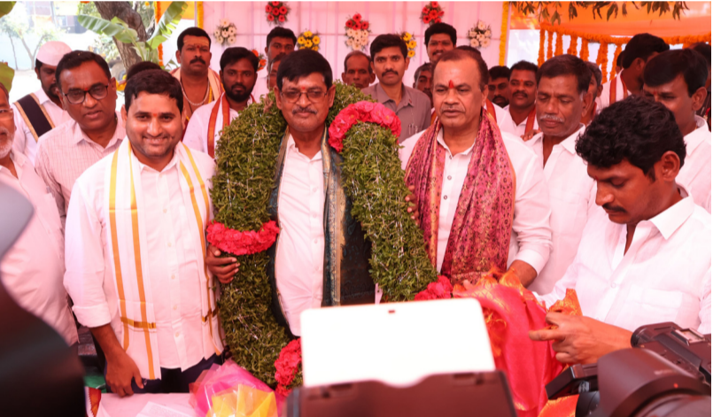
-రోడ్డు ,భవనాలు,సినిమాటోగ్రఫీ శాఖల మంత్రి కోమటిరెడ్డి వెంకటరెడ్డి

సల్పాండ ఆర్మీ,డిసెంబర్ 20,తరంగాలు : ధర్మశివురం రేణుక ఎల్లమ్మ దేవాలయ పాలకవర్గం చైర్మన్, డైరెక్టర్లు వారికి లభించిన పదవిని పదవిగా కాకుండా బాధ్యతగా పనిచేయాలని రోడ్డు ,భవనాలు ,సినిమాటోగ్రఫీ శాఖల మంత్రి కోమటిరెడ్డి వెంకటరెడ్డి సూచించారు.సోమవారం ఆయన ధర్మశివురం రేణుక ఎల్లమ్మ దేవాలయ నూతన పాలకమండలి ప్రమాణ స్వీకారోత్సవ కార్యక్రమానికి ముఖ్యఅతిథిగా హాజరయ్యారు. ఈ సందర్భంగా ఆయన మాట్లాడుతూ దేవునికి సేవ చేస్తూనే భక్తులకు సౌకర్యాలు కల్పించాలని, పాలకవర్గం దేవునికి భక్తులకు అనుసంధానంగా ఉండాలని, దేవాలయాన్ని, పరిసరాలను పరిశుభ్రంగా ఉంచాలని అన్నారు. దేవాలయానికి సల్పాండ నుండి కాకుండా, హైదరాబాద్ నుండి కూడా భక్తులు వచ్చే విధంగా అభివృద్ధి చేయాల్సిన అవసరం ఉందని అన్నారు. రేణుక ఎల్లమ్మ దేవాలయం అభివృద్ధిలో భాగంగా 15 రోజుల్లో చుట్టుపక్కల అంతర్గత రహదారులు మంజూరు చేయడమే కాకుండా పూర్తి చేస్తామని తెలిపారు. దేవాలయ భంక్షన్ హాట్ కార్యాణ మండపం ఎత్తు పెంచేలా కృషి చేస్తామని, దేవాలయ సౌకర్యాల