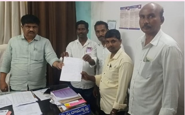
పాలేరు ఆర్డీ, జనవరి 20: (తరంగాలు).

ప్రజాపాలనలో దరఖాస్తు చేసినవారికి రేషన్ కార్డులు ఇవ్వాలి. సిపిఐ (ఎంఎల్ ) న్యూడెమోక్రసీ పార్టీ