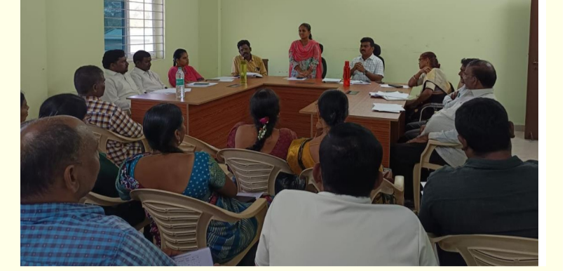
వర్తన్నపేట, 20జనవరి, తరంగాలు :