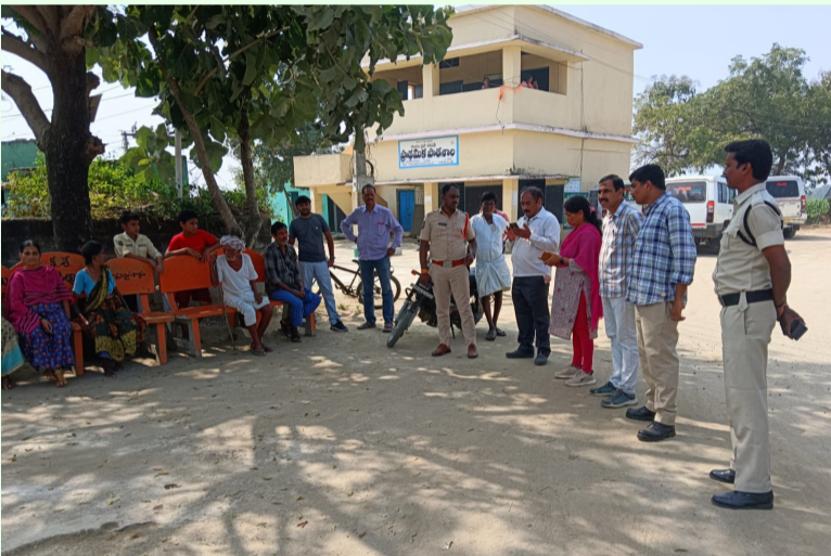
పర్యటన, జనవరి 20