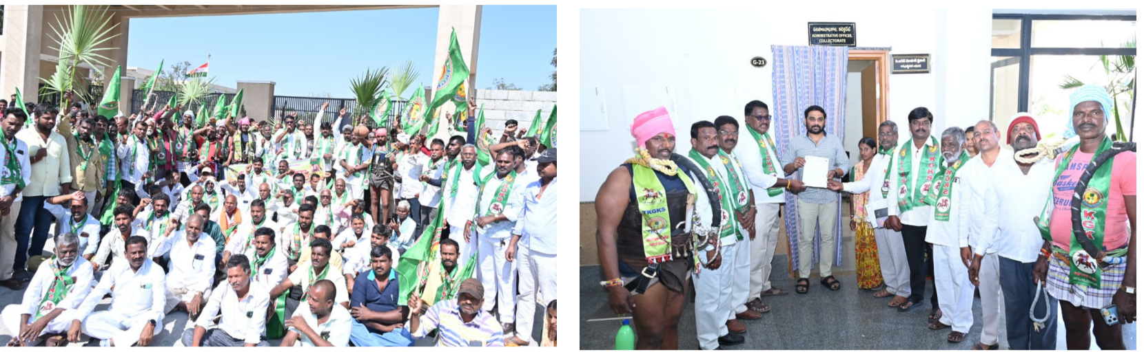
-కల్లుగీత కార్మిక సంఘం రాష్ట్ర ఉపాధ్యక్షులు బోలగాని జయరాములు