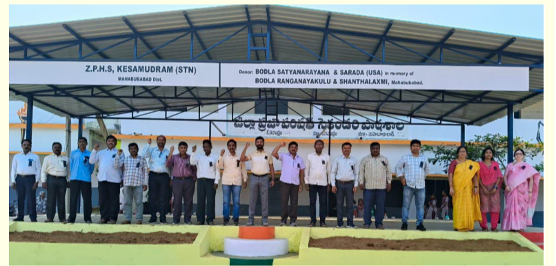
కేసముద్రం, జనవరి 20, (తరంగాలు)