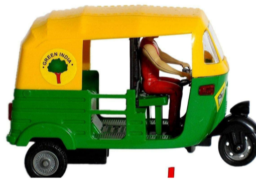
ఆటోను నిలిపాడు.సోమవారం తెల్లవారుజామున నాలుగు గంటలకు చూసే సరికి ఆటో కనిపించలేదు.