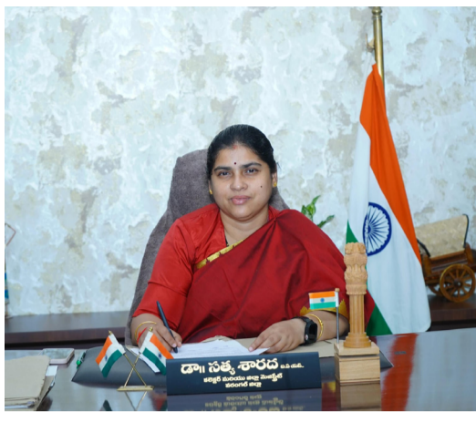
సూచనలు చేశారు. ఈ సందర్భంగా టెలి కాన్ఫరెన్స్ ద్వారా కలెక్టర్ మాట్లాడుతూ వార్డు, గ్రామసభ ప్రారంభం కాగానే ప్రజాపాలన గ్రామసభలో ప్రభుత్వం ఈ నెల 26 నుండి ప్రతిష్ఠాత్మకంగా అమలు