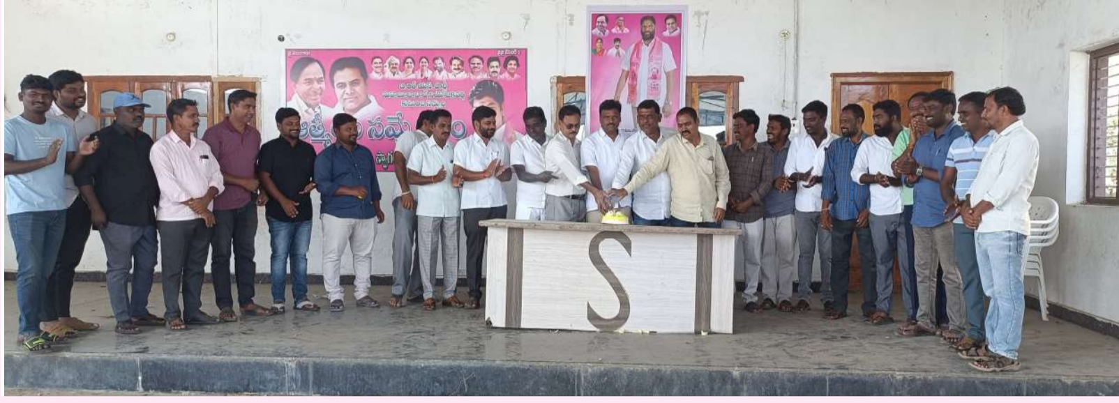
కేసముద్రం, జనవరి 24 (తరంగాలు)