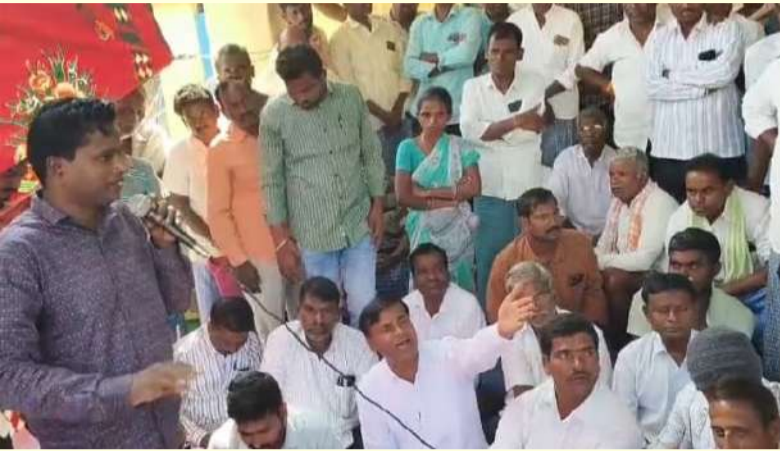
ఆలేరు ఆర్పీ, జనవరి 24(తరంగాలు):