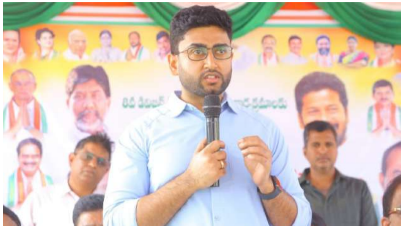
-రాష్ట్ర వ్యవసాయ శాఖా మంత్రి తుమ్మల -249 కోట్లతో వరద డ్రైయిన్ పనులు రాబోయే వర్షాకాలం లోపు పూర్తి కావాలి -8 కోట్లతో స్లాట్ హౌస్ నిర్మాణానికి అనువైన స్థలం ఎంపిక