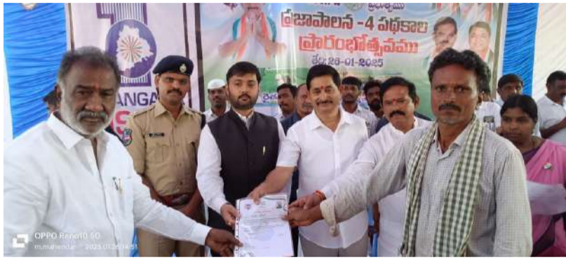
-సీఎం సలహాదారులు వేం నరేందర్ రెడ్డి -పదేళ్లలో రేషన్ కార్డు పక్క గృహాల కోసం పడిగావులు -లబ్ధిదారుల ఎంపిక అనేది నిరంతర ప్రక్రియ -మహాబాబాబాద్ ఎమ్మెల్యే భూక్య మురళి నాయక్