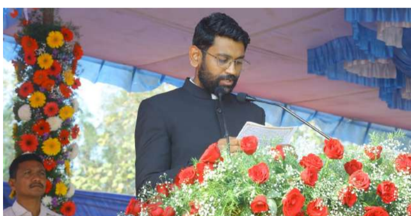
-జిల్లా కలెక్టర్ జితేష్ పాటిల్ -కొత్తగూడెం ప్రగతి మైదానంలో అంగరంగ వైభవంగా గణతంత్ర దినోత్సవ వేడుకలు