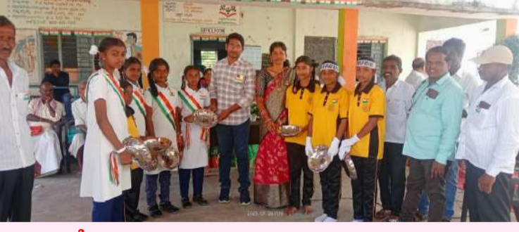
చెన్నారావుపేట, జనవరి 26, తరంగాలు: