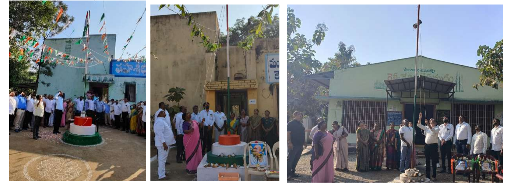
-ఘనంగా గణతంత్ర దినోత్సవ వేడుకలు - మండల వ్యాప్తంగా జాతీయ జెండా ఆవిష్కరణలు..