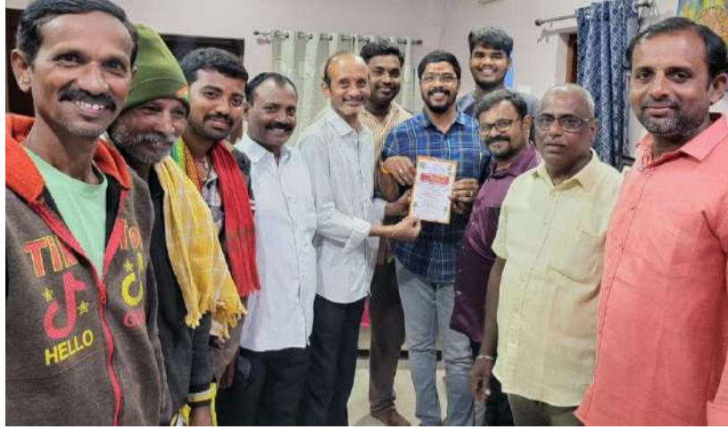
-రూ "50,116/-యాభైవేలు నూటపదహారు వందల ఐదొమ్మిది రూపాయల వరకు సమీక్ష గౌడ్ కు ఆహ్వాన పత్రం అందజేసిన ఇంటికన్నె గౌడ్ కులస్తులు