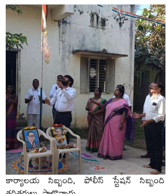
కార్యాలయ సిబ్బంది, పోలీస్ స్టేషన్ సిబ్బంది తదితరులు పాల్గొన్నారు.

జెండా ఆవిష్కరణలు గావించారు. అనంతరం మిఠాయిలు పంపిణీ చేసి శుభాకాంక్షలు తెలియజేసుకున్నారు ఈ సందర్భంగా వారు మాట్లాడుతూ మూడు రంగుల జెండా ఒక్కో రంగు ఒక్కోక్కో విషయాన్ని తెలియజేస్తుందని కాషాయపు రంగు దేశ ప్రతిష్టకు ధైర్యాన్ని ప్రతీకగా నిలిచే మధ్యలో ఉండే తెలుపు రంగు శాంతిని చూపిస్తుందని ఆకుపచ్చ రంగు దేశ ప్రగతికి సూచనలు ఇస్తుందని అశోక చక్రం ధర్మాన్ని సూచిస్తుందని పేర్కొన్నారు. ఆంగ్లేయుల అరాచక పాలన అంతమంచి భావి భారత పౌరులకు విముక్తి కలిగించడం కోసం చేపట్టిన స్వాతంత్ర్య ఉద్యమంలో ఎందరో మహనీయుల త్యాగ ఫలితమే నేడు ఈ గణతంత్ర దినోత్సవం అని పేర్కొన్నారు. ఈ కార్యక్రమంలో మండల స్థాయి అధికారులు, ఎంపీడిఎం కార్యాలయ సిబ్బంది, తహసీల్దార్ కార్యాలయ సిబ్బంది, వ్యవసాయ మార్కెట్