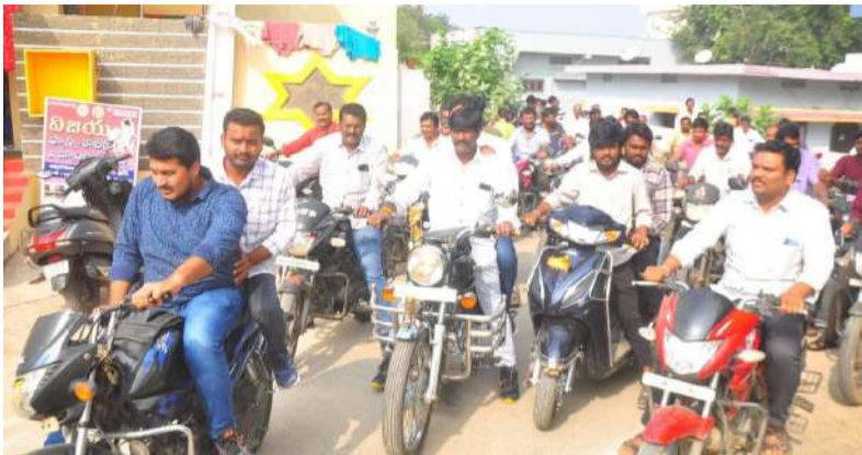
తరంగాలు/ఖమ్మం జిల్లా బ్యూరో ఖమ్మం :

-నాయి బ్రాహ్మణ సంఘం ఆధ్వర్యంలో భారీ బైక్ ర్యాలీ