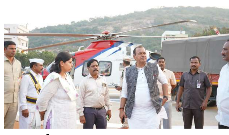
-మంత్రి కోమటిరెడ్డి వెంకట్ రెడ్డి