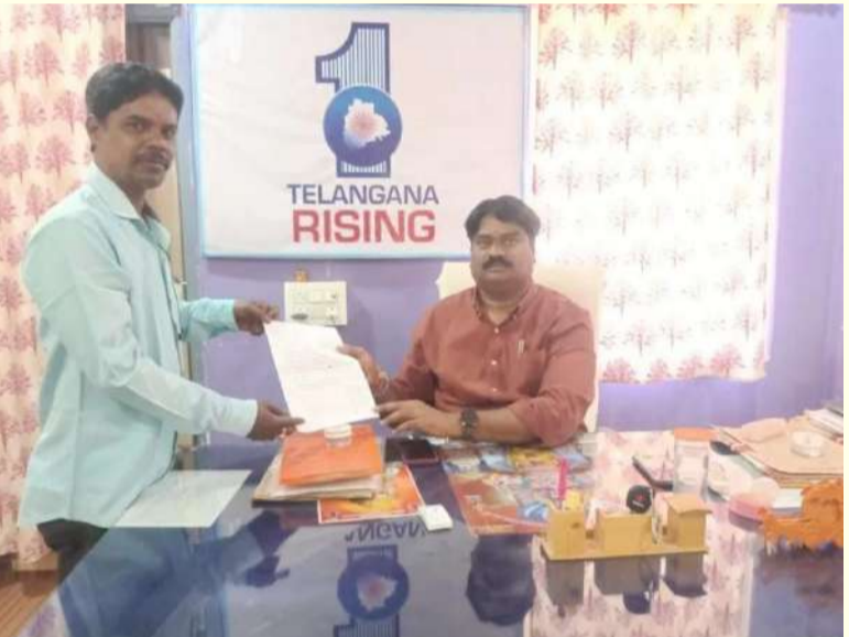
అలేరు ఆర్పీ, జనవరి 22(తరంగాలు):