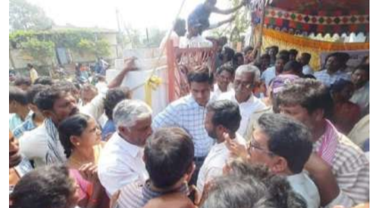
-రెండవ రోజు బాహా బాహి గ్రామ సభలు..ఆదికారులను నీలదీసిన గ్రామస్తులు.