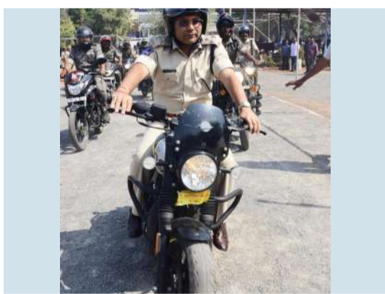
వరంగల్ పోలీస్ కమిషనర్ అంబర్ కిషోర్ రూ