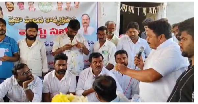
మహబూబాబాద్ బ్యారో జనవరి 22 (తరంగాలు)