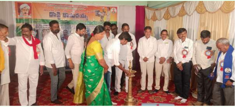
మహబూబాబాద్ జిల్లా బ్యూరో జనవరి 29 (తరంగాలు)