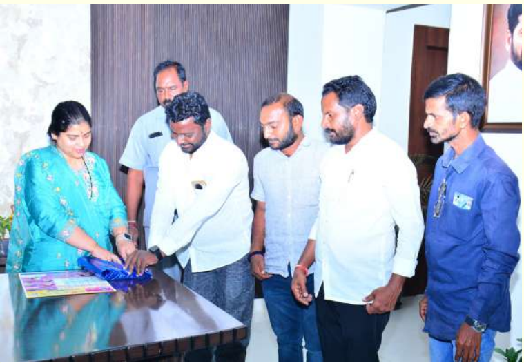
-వరంగల్ జిల్లా కలెక్టర్ డాక్టర్ సత్య శారదా -తరంగాలు జాతీయ తెలుగు దినపత్రిక నూతన సంవత్సర క్యాలెండర్-2025 ను ఆవిష్కరించిన కలెక్టర్