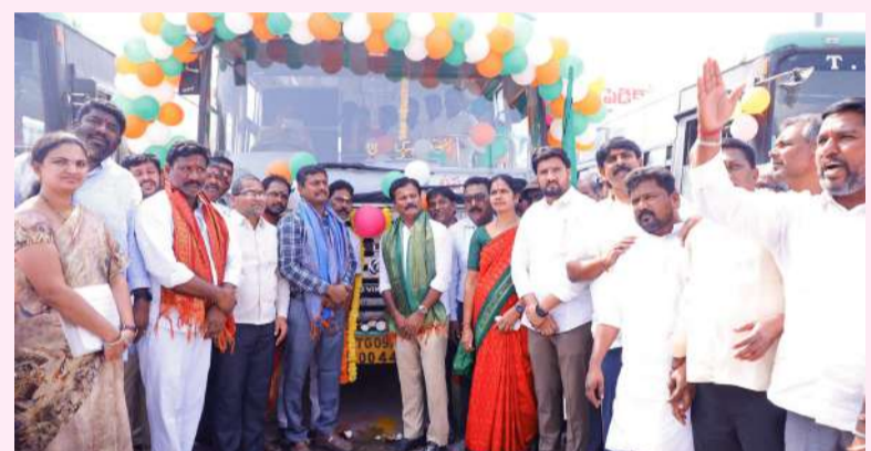
ఆలేరు ఆర్టీ, జనవరి 10(తరంగాలు) :