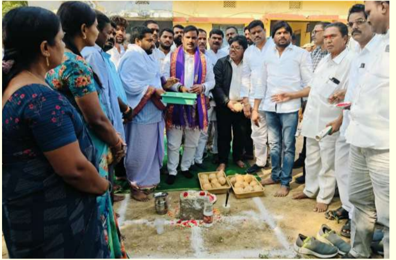
ఆలేరు ఆర్టీ, జనవరి 10(తరంగాలు):

యాదాద్రి భువనగిరి జిల్లా యాదగిరిగుట్ట మండలంలో పలు అభివృద్ధి కార్యక్రమాలలో పాల్గొన్న తెలంగాణ రాష్ట్ర ప్రభుత్వ విప్ ఆలేరు ఎమ్మెల్యే బీర్ల ఐలయ్య. యాదగిరిగుట్ట మండల పరిషత్ కార్యాలయం ప్రాంగణంలో నమూనా ఇందిరమ్మ ఇల్లు నిర్మాణానికి భూమి పూజ చేసిన ఎమ్మెల్యే బీర్ల ఐలయ్య అనంతరం రాళ్ల జనగాం గ్రామంలో సిసి రోడ్డు పనుల నిర్మాణం కోసం శంకుస్థాపన చేసిన ప్రభుత్వ విప్ ఆలేరు ఎమ్మెల్యే బీర్ల ఐలయ్య. ఈ కార్యక్రమంలో మండల అధికారులు, మండల నాయకులు, కార్యకర్తలు, ఆయా గ్రామాల ప్రజలు పాల్గొన్నారు.