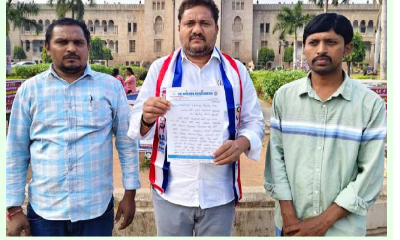
మిర్యాలగూడ ఆర్పీ, జనవరి 10(తరంగాలు):