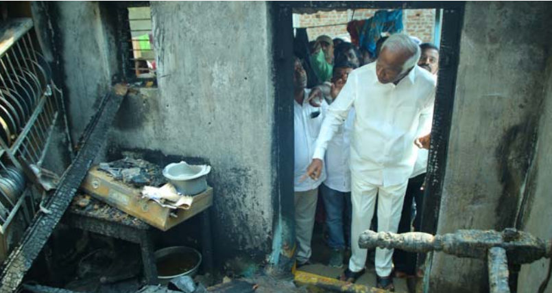
-బాధిత కుటుంబాన్ని పరామర్శించిన ఎమ్మెల్యే కడియం శ్రీహరి

జువ్వల ప్రతినిధి, ఫిబ్రవరి 27, (తరంగాలు): మండలంలోని కోనాయిచలం గ్రామంలో ఒక కుటుంబానికి చెందిన ఇద్దరు అన్నదమ్ములు జోగు బాబు, రాజు ఇల్లు విద్యుత్ ఘాతంతో పూర్తిగా కాలిపోవడంతో విషయం తెలుసుకున్న మాజీ ఉప ముఖ్యమంత్రి, స్టేషన్ ఘనపూర్ ఎమ్మెల్యే కడియం శ్రీహరి వారి ఇంటికి వెళ్లి దగ్గం అయిన ఇంటిని పరిశీలించి బాధిత కుటుంబ సభ్యులను పరామర్శించారు. ఆందోళన చెందాల్సిన అవసరం లేదని వెంటనే బాధితులకు ఇందిరమ్మ ఇల్లు మంజూరు చేస్తానని హామీ ఇచ్చారు. వెంటనే స్థానిక