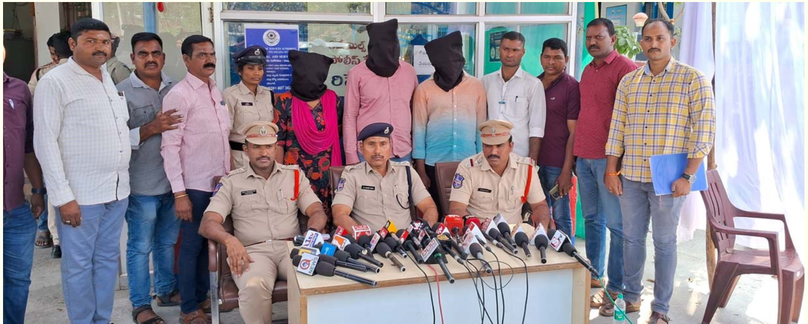
-అక్రమ సంబంధానికి అడ్డుపెట్టినాడని భర్తను హత మార్చేందుకు భార్య పన్నాడని