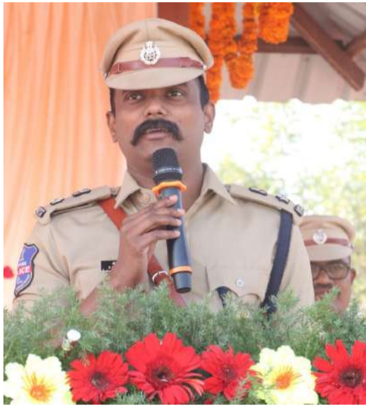
-జిల్లా ఎస్పీ రోహిత్ రాజు