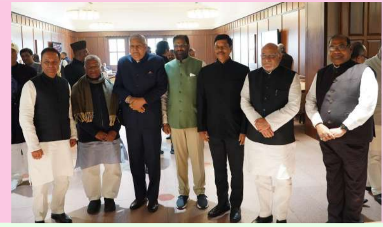
హైదరాబాద్, 31జనవరి, తరంగాలు:

రాజ్యసభ సభ్యులు వడ్డెరాజు రవిచంద్ర,కే.ఆర్.సురేష్ రెడ్డి,దీపకాండ దామోదర్ రావు,డాక్టర్ బండి పార్థసారథి రెడ్డి తదితరులు పార్లమెంటులో ఉప రాష్ట్రపతి, రాజ్యసభ చైర్మన్ జగదీష్ ధనఖర్ ను మర్యాదపూర్వకంగా కలిశారు.పార్లమెంట్ బడ్జెట్ సమావేశాలు శుక్రవారం రాష్ట్రపతి ద్రౌపది ముర్ము ప్రసంగంతో ప్రారంభమైన విషయం తెలిసింది. పార్లమెంట్ ఉభయ సభల సమావేశంలో రాష్ట్రపతి ప్రసంగం ముగిసిన తర్వాత ఎంపీలు రవిచంద్ర, సురేష్ రెడ్డి, దామోదర్ రావు, పార్థసారథి రెడ్డిలు రాజ్యసభ చైర్మన్ జగదీష్ ధనఖర్ ను మర్యాదపూర్వకంగా కలిసి కొద్దిసేపు ముచ్చటించారు.