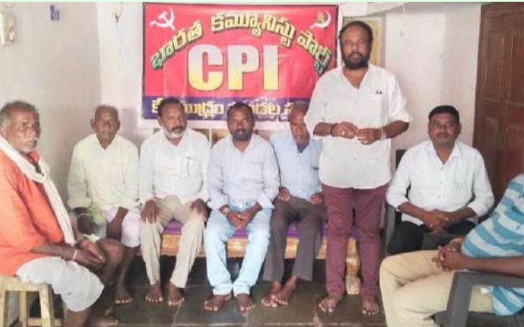
కేసముద్రం, జనవరి 31, (తరంగాలు)