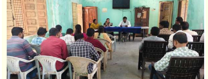
జువ్వల ప్రతినిధి, జనవరి 31, (తరంగాలు):