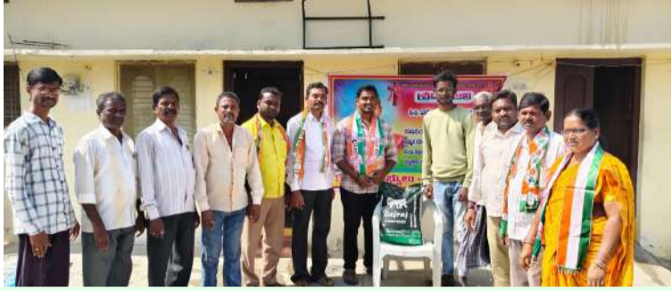
ఆలేరు ఆర్పీ, జనవరి 31(తరంగాలు):