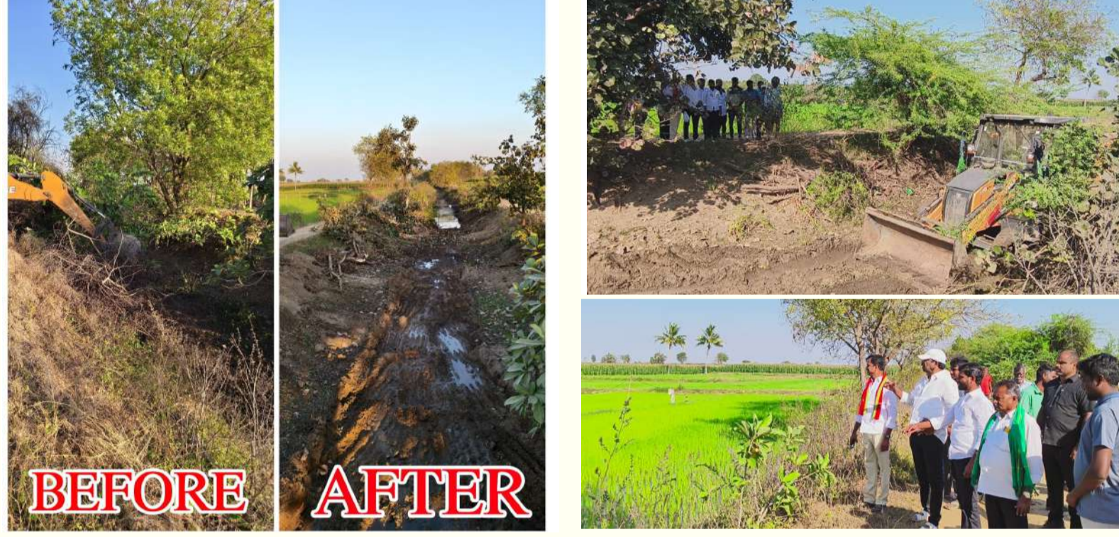
-వర్షన్నపేట ఎమ్మెల్యే కేఆర్ నాగరాజు