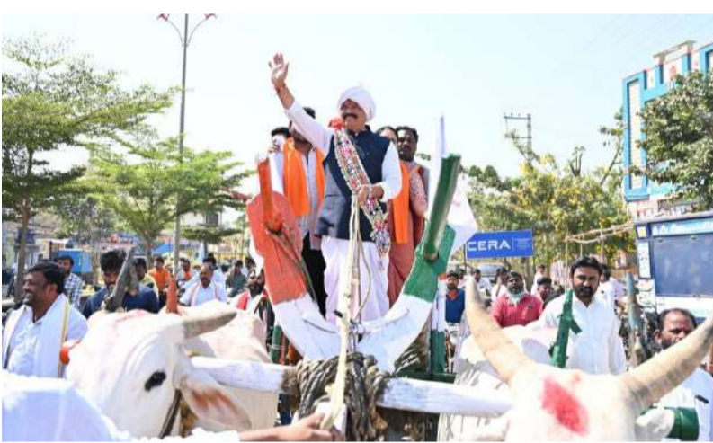
-శ్రీ సంత సేవాలాల్ మన అందరి ఆరాధ్యదైవం... ఎమ్మెల్యే డా.మురళీ నాయక్.