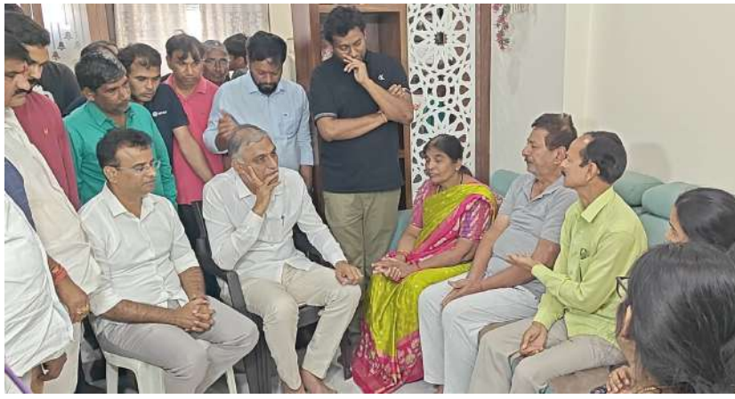
-మాజీమంత్రి తన్నీరు హరీష్ రావు