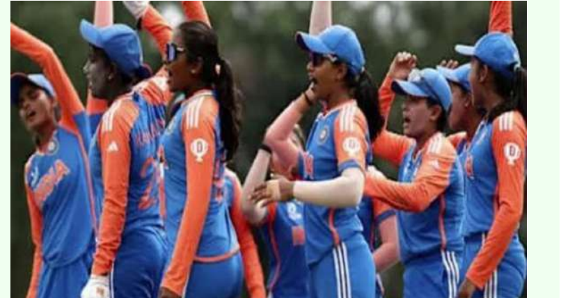
మహబూబాబాద్ జిల్లా బ్యూరో ఫిబ్రవరి 2 (తరంగాలు)