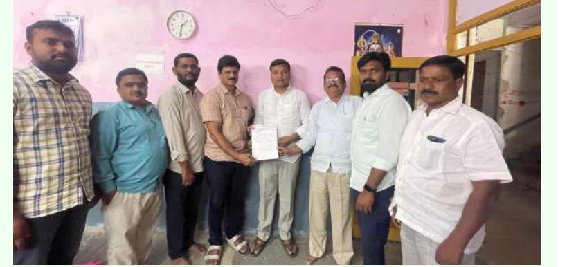
మహబూబాద్ జిల్లా బ్యూరో ఫిబ్రవరి 02 (తరంగాలు)