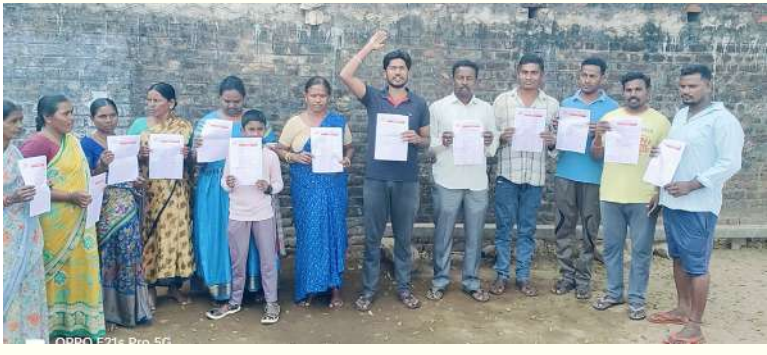
మహాబాబాబాద్ జిల్లా డ్యూరర్ ఫిబ్రవరి 2 (తరంగాలు)

అరుణోదయ సంస్కృతిక సమైక్య 1974న హైదరాబాద్ ఉస్మానియా యూనివర్సిటీ లో