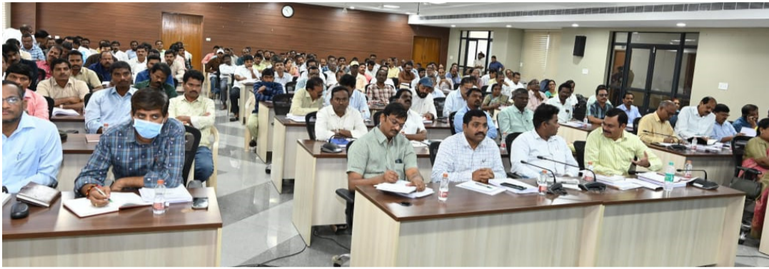
మహబూబాబాద్ జిల్లా బ్యూరో ఫిబ్రవరి 11(తరంగాలు)