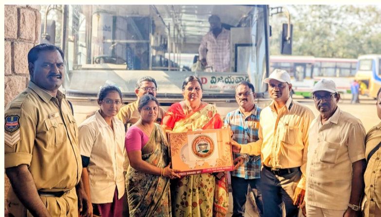
మిర్యాలగూడ, 11 ఫిబ్రవరి, తరంగాలు:

లక్ష్మీ డ్రాలో గెలుపొందిన మహిళలకు బహుమతులు అందజేత