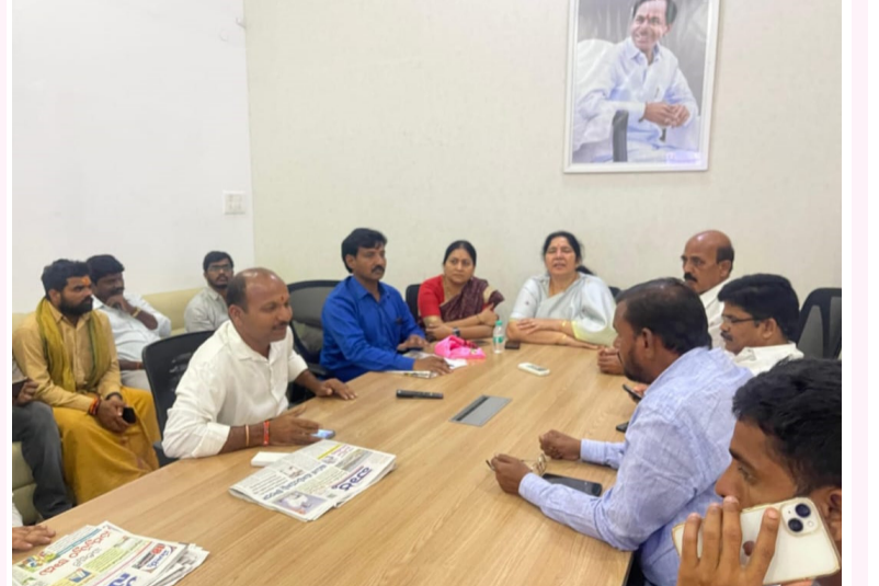
మహబూబాబాద్ జిల్లా బ్యూరో ఫిబ్రవరి 11 (తరంగాలు)

కేసీఆర్ సంక్షేమ పథకాలకు మొదటి లబ్ధిదారులు గిరిజనులు, దళితులే, కానీ కాంగ్రెస్ రేవంత్ రెడ్డి పాలనలో గిరిజనులకు పద్నాలుగు నెలలు గా పద్నాలుగు పైసల పని కాలేదు. ఈ నెల 15న సేవాలాల్ మహారాజ్ జయంతి సందర్భంగా బీఆర్ఎస్ కేంద్ర కార్యాలయం తెలంగాణ భవన్ లో ప్రత్యేక వేడుకలు నిర్వహిస్తున్నాం. ఈ వేడుకలకు పార్టీ పర్సన్ల ఫ్రెండెండ్ల శ్రీ కేటీఆర్, గిరిజన ప్రముఖులు హాజరవుతారు, గిరిజనులు పెద్ద ఎత్తున పాల్గొని విజయవంతం చేయాలి అన్నారు. మాజీ మంత్రి, శాసన మండలి బి ఆర్ ఎస్ పార్టీ వివ్ శ్రీమతి సత్యవతి రాథోడ్, పిలుపునిచ్చారు.