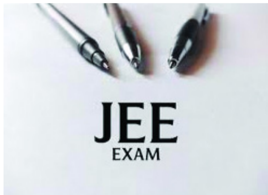
ఉండటం విశేషం. జేఈఈ (మెయిన్) పేపర్ -2 (బీఆర్/బి షానింగ్) ఫలితాలను తర్వాత