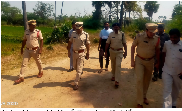
కఠిన చర్యలు తప్పవని పేర్కొన్నారు. కమిషనరేట్ వ్యాప్తంగా ఇసుక అక్రమ రవాణా పై పోలీస్ శాఖ ఎన్ఫోర్స్ చర్యలు, పోలీస్ సిబ్బంది ఉన్నారు.

జుఫర్గడ్ ప్రతినీధి, ఫిబ్రవరి 13, (తరంగాలు): అక్రమంగా ఇసుక రవాణా చేస్తే కఠిన చర్యలు తీసుకోవాలని వరంగల్ పోలీస్ కమిషనర్ అంబర్ కిషోర్ రూూ అధికారులను ఆదేశించారు. గురువారం జుఫర్గడ్ మండలం ఉప్పుగల్లు శివారులోని ఆకేరు పరివాహక ప్రాంతంలో అక్రమ ఇసుక రవాణాను వరంగల్ పోలీస్ కమిషనర్ అంబర్ కిషోర్ రూూ పరిశీలించారు. అనంతరం సిపి మాట్లాడుతూ అనుమతులు లేకుండా ఇసుక అక్రమ రవాణా చేస్తే