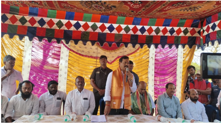
-రానున్న స్థానిక ఎన్నికల్లో వీధుల్లో కూడా తిరగనివ్వకుండా ఓటుతో బుద్ధి చెప్పేందుకు ప్రజలు సిద్ధంగా ఉన్నారు.. ఎమ్మెల్యే డా.భూక్యా మురళీ నాయక్.