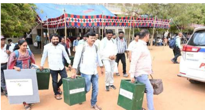
మహాబాబాబాద్ జిల్లా బ్యూరో ఫిబ్రవరి 26 (తరంగాలు)

నల్లగొండ - వరంగల్ -ఖమ్మం ఉపాధ్యాయ ఎమ్మెల్సీ ఎన్నికల పోలింగ్ సందర్భంగా బుధవారం మహాబాబాబాద్ పట్టణంలోని ఫాతిమా హైస్కూల్ నుండి జిల్లాలోని (16) కేంద్రాలకు సంబంధించి ఎన్నికల సామాగ్రి పంపిణీ చేయడం జరిగింది. ఈ సందర్భంగా జిల్లా ఎన్నికల అధికారి కలెక్టర్ అద్వైత్