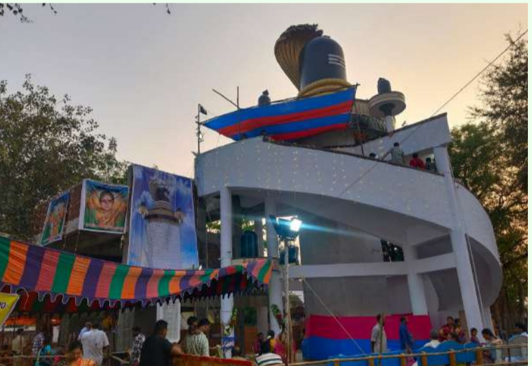
వరంగల్ టౌన్, ఫిబ్రవరి, 26, (తరంగాలు)