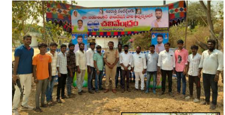
గణపరం ఫిబ్రవరి 26 తరంగాలు: