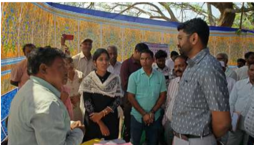
-జిల్లా కలెక్టర్ జితేష్ పాటిల్