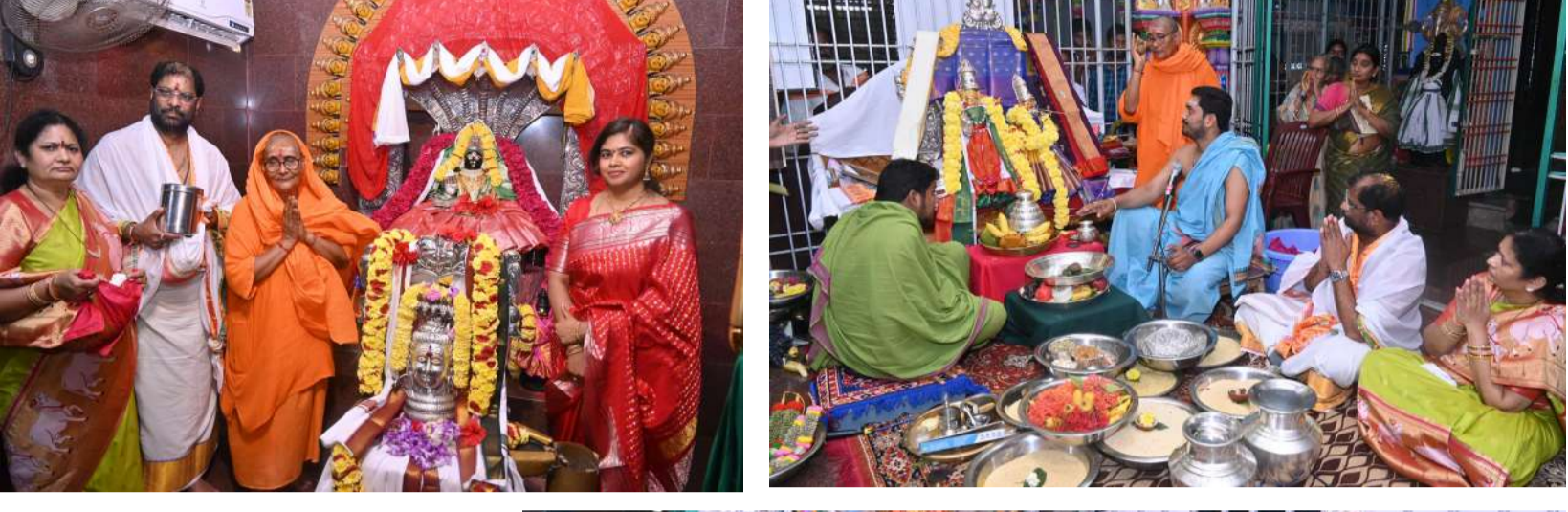
హైదరాబాద్ ప్రతినిధి, 25 ఫిబ్రవరి, తరంగాలు: