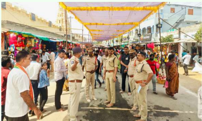
మహాబాబాబాద్ జిల్లా బ్యూరో ఫిబ్రవరి 26 (తరంగాలు)