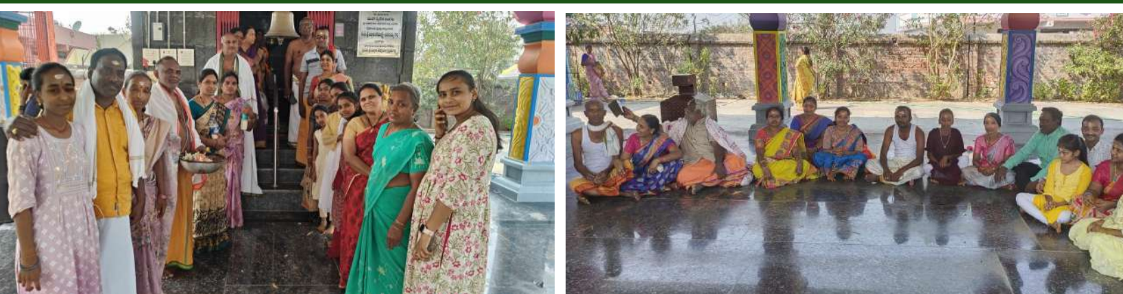
జఫర్పేట ప్రతినది, ఫిబ్రవరి 26, (తరంగాలు):

మహాశివరాత్రి పర్వదినాన్ని పురస్కరించుకొని మండలంలోని పలు శివాలయాలు భక్తుల శివనామ స్మరణతో మార్చోగాయి. ఈ పర్వదినాన్ని పురస్కరించుకొని మండలంలోని జఫర్ గడ్, కూనూర్, తిడుగు, తమ్మడపల్లి-బ, తిమ్మంపేట గ్రామాలలోని శివాలయాల విద్యుత్ దీపాలతో, రంగురంగుల పూలతో ముసాబు చేయడం జరిగింది. తెల్లవారు జామునుండే భక్తులు ఆలయాలకు క్యూ కట్టి