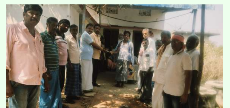
ఆలేరు ఆర్సీ, ఫిబ్రవరి 26(తరంగాలు):

మృతుని కుటుంబానికి 5000ల ఆర్థిక సహాయం అందించిన కేహెచ్ఆర్ ఫౌండేషన్.