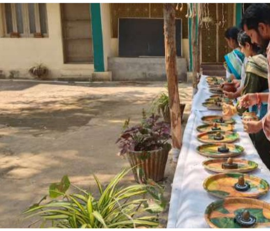
-శివ నామస్మరణతో మార్చోగిన క్షేత్రాలు -భక్తులతో పోటెత్తిన ఆలయాలు