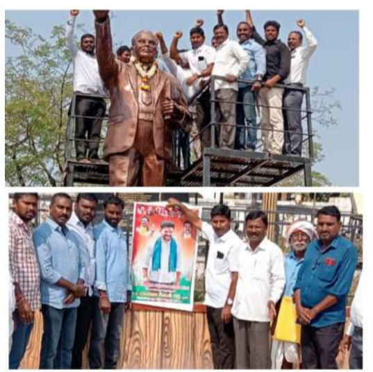
నెరవేరిందని, కాంగ్రెస్ పార్టీ స్వతంత్రం తెచ్చిన పార్టీ అని, తెలంగాణ ఇచ్చిన పార్టీ అని, కులగణన చేసిన పార్టీ అని, ఎస్సీ వర్గీకరణ చేసిన పార్టీ అని