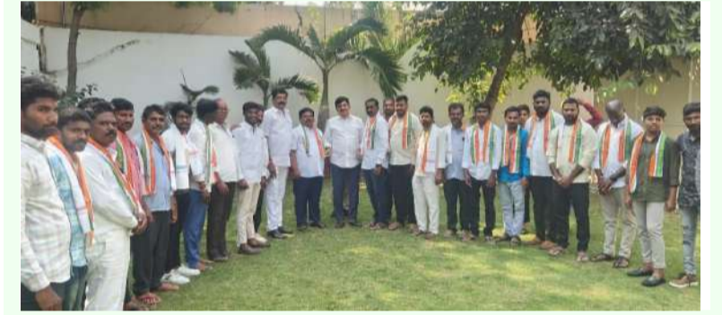
ఖమ్మం జిల్లా బ్యూరో ఫిబ్రవరి 6 (తరంగాలు) ఖమ్మం :

-మంత్రి పొంగులేటి సమక్షంలో కాంగ్రెస్ పార్టీ కండువా కప్పుకున్న బి ఆర్ ఎస్ నాయకులు