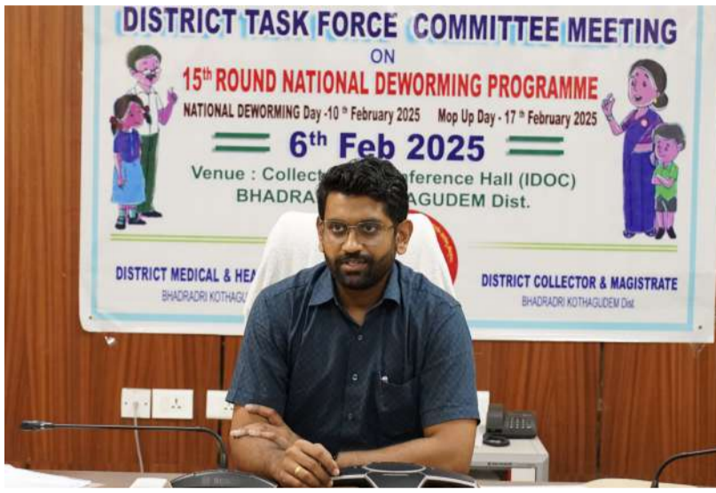
-జిల్లా కలెక్టర్ జితేష్ పాటిల్