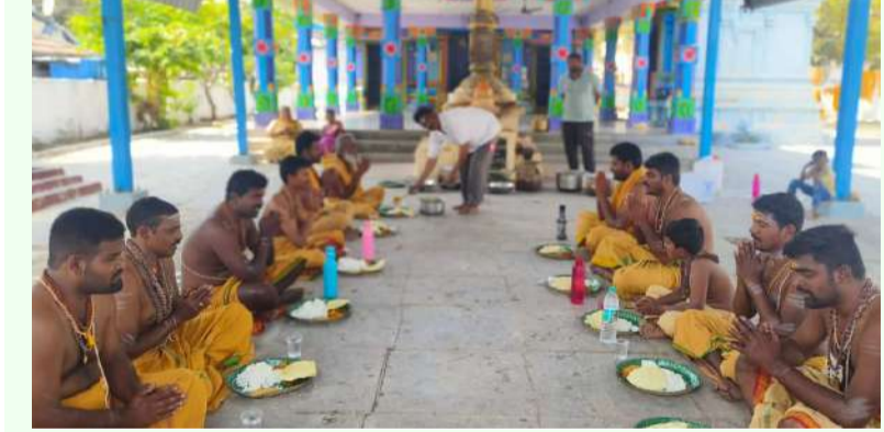
ఆలేరు ఆర్సీ, ఫిబ్రవరి 06 (తరంగాలు):