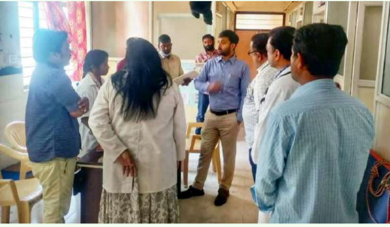
మహబూబాబాద్ జిల్లా బ్యూరో ఫిబ్రవరి 06 (తరంగాలు)