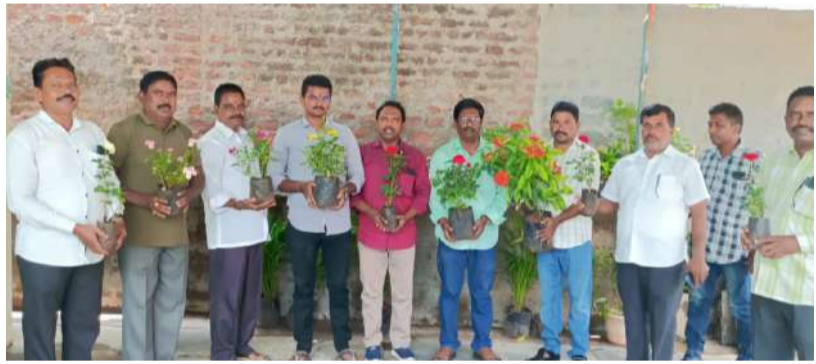
-ప్రెస్ క్లబ్ ను పరిశుభ్రంగా ఉంచటం జర్నలిస్టుల బాధ్యత

ఖమ్మం జిల్లా బ్యూరో/ఫిబ్రవరి 6(తరంగాలు) ఖమ్మం : సొంతింటి కంటే కూడా జర్నలిస్టులకు