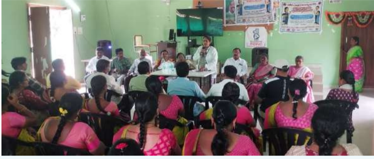
వెన్నారావుపేట ఫిబ్రవరి 6 తరంగాలు