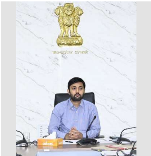
మహబూబాబాద్ జిల్లా బ్యూరో ఫిబ్రవరి 06 (తరంగాలు)