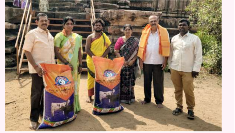
గణపవరం, ఫిబ్రవరి 10 (తరంగాలు):