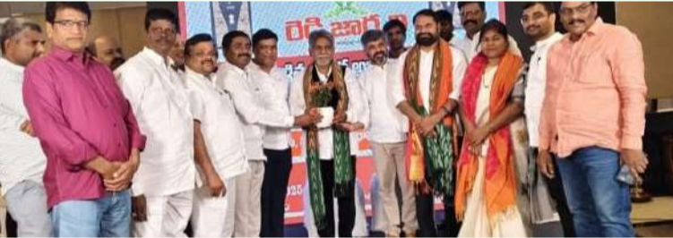
ఆలేరు ఆర్ట్స్, ఫిబ్రవరి 10(తరంగాలు):

-పాల్గొన్న ఎంఆర్పిఎస్ అధినేత మంద కృష్ణ మాదిగ -రెడ్డి జాగృతి సంస్థ ఆధ్వర్యంలో తాజ్ దక్కన్ హోటల్లో