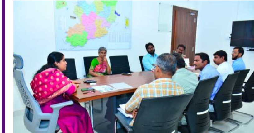
-వరంగల్ జిల్లా కలెక్టర్ డాక్టర్ సత్య శారదా