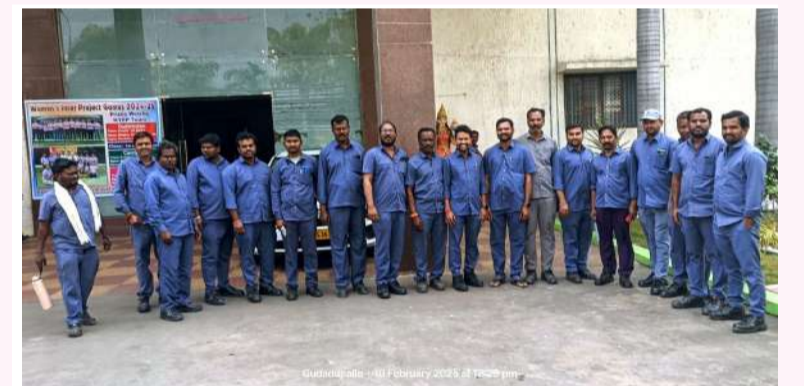
గణపవరం, ఫిబ్రవరి 10 (తరంగాలు)