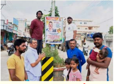
మహాబాబాద్ జిల్లా బ్యూరోమార్చి 23 తరంగాలు: