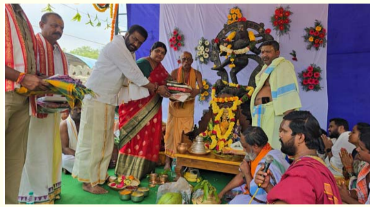
ఐనవోలు, 23 మార్చి, తరంగాలు: