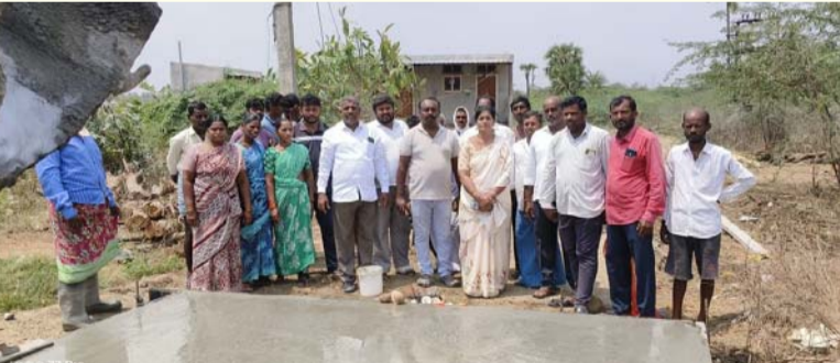
జువ్వల ప్రతినిధి, మార్చి 23, తరంగాలు: