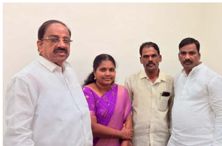
అలేరు ఆర్పీ, మార్చి 25(తరంగాలు):