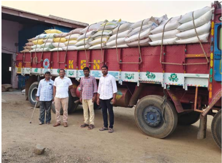
మహబూబాబాద్ జిల్లా బ్యూరో మార్చి 25 తరంగాలు:

రేషన్ బియ్యం పట్టుకున్న జిల్లా అధికారులు, రేషన్ బియ్యం అక్రమంగా తరలిస్తే కఠిన చర్యలు,