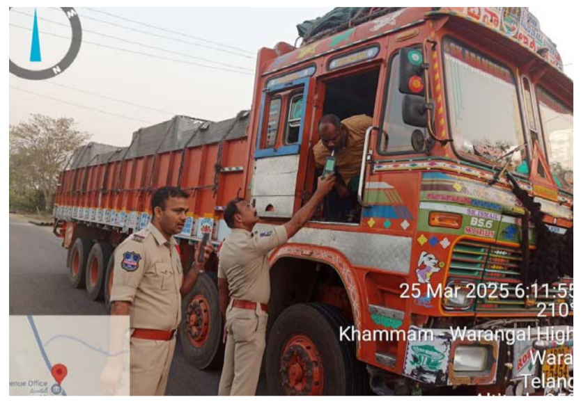
వర్ధన్నపేట ఎస్ఐ భూక్యా చందర్ ముమ్మరంగా వాహనాలు తనిఖీ చేపట్టిన పోలీసులు