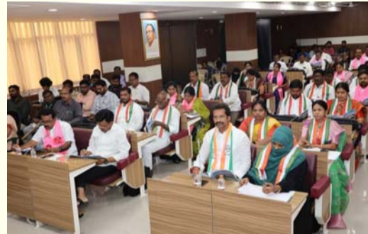
ఖమ్మం జిల్లా బ్యూరో/మార్చి 25(తరంగాలు) ఖమ్మం :