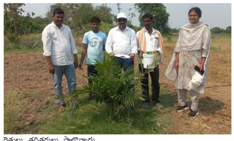
రైతులు, తదితరులు పాల్గొన్నారు.

గురువారం తొర్రూరు, దంతాలపల్లి, నర్సింహులపేట, నెల్లికుదురు, మహబూబాబాద్ మండలాలలోని పలు గ్రామాలలో సాగులో ఉన్న ఆయిల్ పామ్ తోటలను జిల్లా ఉద్యాన మరియు పట్టు పరిశ్రమ అధికారి జినుగు మరియు, వ్యవసాయ అధికారి మరియు ఆయిల్ ఫెడ్ ఫీల్డ్ అధికారులు పరిశీలించారు. ప్రస్తుతం తోటలకు నల్ల కొమ్మ పురుగు (రైనోసిరస్ బీటిల్) ఆశించే అవకాశం ఉన్నందున రైతులు నల్ల కొమ్మ పురుగు (రైనోసిరస్ బీటిల్) ఆశించకుండా తగు చర్యలు/జాగ్రత్తలు తీసుకోవాలని తెలిపారు. నల్ల కొమ్మ పురుగు నివారణకు రైతులు తీసుకోవలసిన చర్యలు నల్ల కొమ్మ పురుగు నుండి ఎప్పటికప్పుడు మొక్కలను కాపాడుకోవాలని, లేత తోటల్లోని మొక్కలకు 20 గ్రాముల ఫోరేట్ గుళికలను మొవ్వ భాగంలో పెట్టాలని, కాపు కాసే తోటలలో లింగాకర్షక బుట్టలు వాడాలని, జీవ నియంత్రణ పద్ధతులు పాటించి నివారించు కోవాలన్నారు. ఈ కార్యక్రమంలో