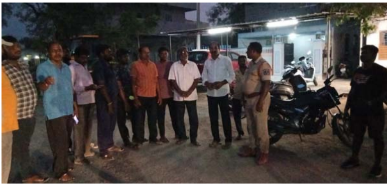
ఆలేరు ఆర్పి, మార్చి28(తరంగాలు):