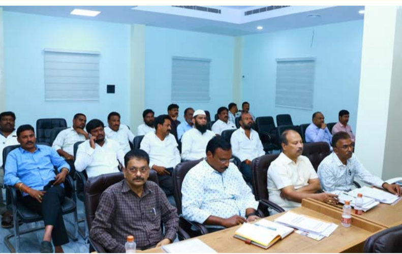
రాష్ట్ర రోడ్డు,భవనాలు, సినిమాటోగ్రఫీ శాఖల మంత్రి కోమటిరెడ్డి వెంకటరెడ్డి