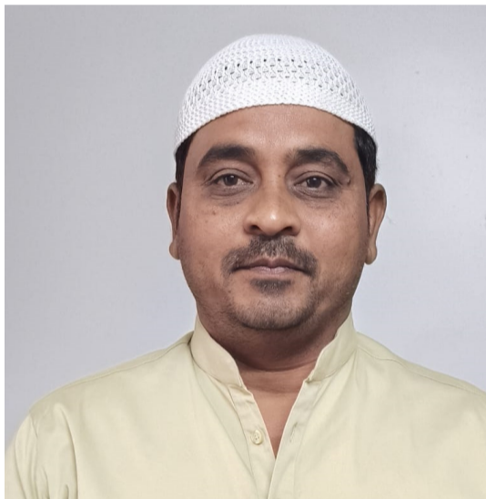
జరుపుకునే అతిపెద్ద పవిత్రమైన రంజాన్ మాసం ప్రారంభమై న సమయంలో కూడా ఇమామ్ మౌజుద్దీన్ల పట్ల ఇంత నిర్లక్ష్యంగా వ్యవహరించడం ప్రభుత్వానికి