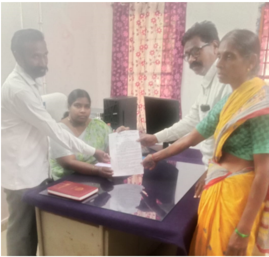
ఇబ్బందులకు గురవుతున్నారని అన్నారు. కాబట్టి రాష్ట్ర