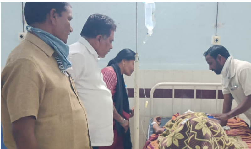
చెన్నారావుపేట మార్చి 6 (తరంగాలు)