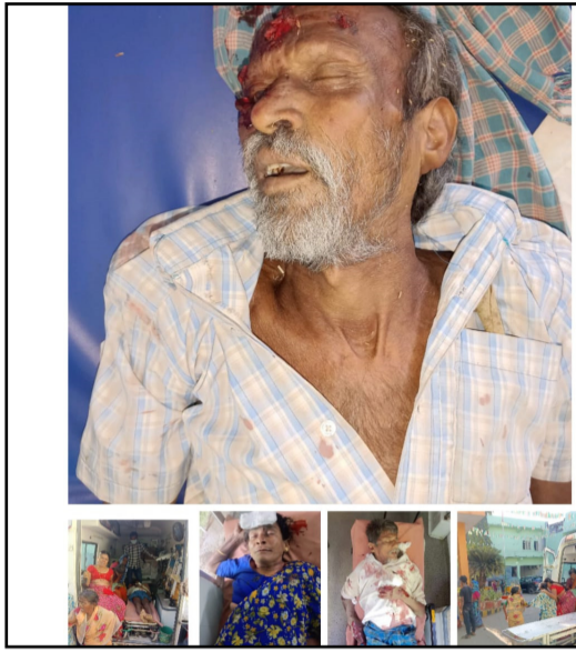
సమాచారాన్ని అందించారు. యువకుడు కథనం ప్రకారం సుమారు కిలోమీటర్లు దూరం నుండే