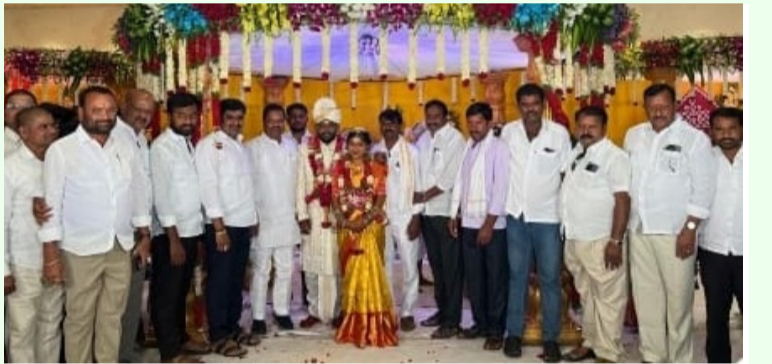
ఆర్పీ, మార్చి 06(తరంగాలు):