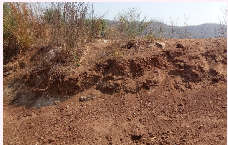
నల్లబెల్లి / మార్చి 7 తరంగాలు:

వరంగల్ జిల్లా నల్లబెల్లి మండలంలో పంటలు ఆశీనంత మేరకు పండలేదు పత్తి పంట లద్ది పురుగు, గులాబీరంగు పురుగుతో పంట పండక కూలీలకు పని లేదు, ఎలాగైనా మిర్చి పంట తో నైన కూలీలకు సరిపడా పని దొరుకుతుంది అనుకుంటే మిర్చి పంట నల్లి తమరపురుగు వల్ల కూలీలకు పని లేకుండా చేయటమే కాకుండా రైతులను నిండా ముంచింది. రైతులు మొక్క జొన్న పంటలు వేసిన హార్వెస్టర్ తో మొక్క జొన్న కోయటం వల్ల కూలీలకు పని లేకుండా పోయింది. ఏం పనులు లేకుండా ఇబ్బంది పడుతున్నా కూలీలకు ఎంతో ప్రతిష్టాత్మకంగా కేంద్ర రాష్ట్ర ప్రభుత్వాలు అమలు చేసిన ఉపాధి హామీ పథకంలో పనులకు వెళ్లాలంటే అక్కడ పనులు లేక కూలీలు తీవ్ర ఇబ్బందులు పడుతున్నారు. ఉపాధి హామీ పథకంలో కూలీలకు ఉపయోగకరంగా వుండే చెరువు పూడిక తీత పనులు లేవు. వలస కూలీలకు వెళ్లమంటే ప్రమాదాలకు గురి అయ్యే అవకాశం ఉన్నందున కూలీలకు ఉపాధి పనులు అయిన కల్పించాలని ఉపాధి హామీ పథకంలో చాలా రకాల పనులు వున్నందున వాటిని గ్రామాలలో ప్రారంభించి మమ్మల్ని ఆదుకోవాలని ఉపాధి హామీ కూలీలు రైతులు కోరుతున్నారు