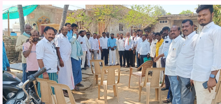
జఫర్ నగర్ ప్రతినిధి, మార్చి 07, (తరంగాలు):

ఈ నెల 16న స్టేషన్ ఘనపూర్ నియోజకవర్గంలో జరిగే ముఖ్య మంత్రి రేవంత్ రెడ్డి బహిరంగ సభను విజయవంతం చేయడంకోసం స్థానిక శాసన సభ్యులు మాజీ ఉప ముఖ్యమంత్రి కడియం శ్రీహరి ఆదేశానుసారం జఫర్ నగర్ మండలం లోని తిమ్మంపేట, లక్ష్మినాయక్ తండా, తీగారం, సూరారం, హిమ్మత్ నగర్, తిమ్మాపూర్, గ్రామాలలో మండల పార్టీ అధ్యక్షులతో గ్రామ కాంగ్రెస్ పార్టీ కార్యకర్తల సమావేశాలు నిర్వహించారు. ఈ సమావేశాల్లో పార్టీ ప్రతి గ్రామంలో యువజన, మహిళా, సోషల్ మీడియా కమిటీలను ఏర్పాటు చేశారు. అనంతరం మండల పార్టీ ముఖ్య నాయకులు మాట్లాడుతూ, ప్రతి గ్రామం నుండి ఒక్కో బాత్ కు 150 మందికి తగ్గకుండా బహిరంగ సభకు వచ్చేలా చూడాలని పార్టీ శ్రేణులకు పిలుపునిచ్చారు. భారీగా జన సమీకరణంతో వెళ్లి ముఖ్య మంత్రి రేవంత్ రెడ్డి బహిరంగ సభను విజయవంతం చేయాలని వారు కోరారు. ఈ కార్యక్రమాల్లో పార్టీ జిల్లా, నియోజకవర్గ, మండల, గ్రామ పార్టీ నాయకులు, కార్యకర్తలు, అభిమానులు అధిక సంఖ్యలో పాల్గొన్నారు.