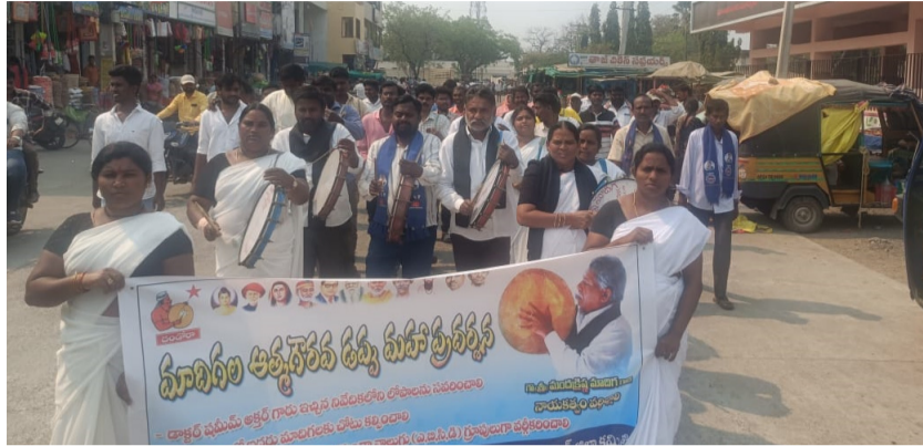
మహబూబాబాద్ జిల్లా బ్యూరో మార్చి 07 (తరంగాలు)